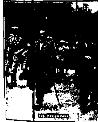
czoło pochodu P. P. S. w al. Ujazdowskich