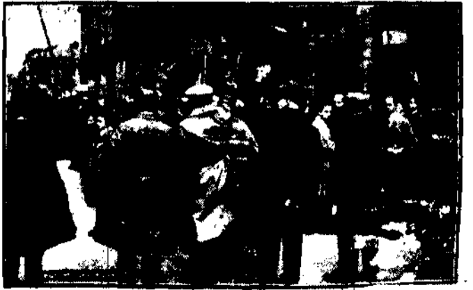
MILICJA P. P. S. UTRZYMUJE KARNOSĆ W SZEREGACH