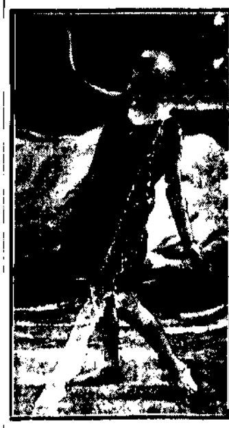
Kuchnia do kąpiel i pokona cich.