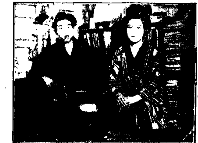
PAN I PANI IKAKAGIE

On, głodny literat, przernicza się teraz na scenariusze filmowe — ona, znana aktorka.