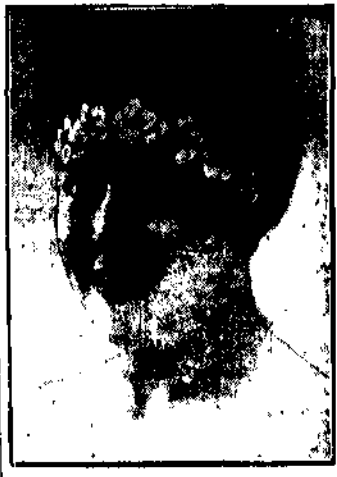
w gumowym czepczku do kąpiel.