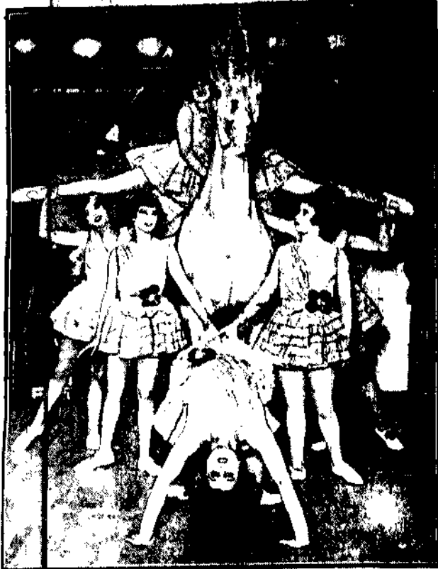
otoczony kłódką „Hypodrome - girls” na scenie jednego z kondygnacyjnych kabaretów.