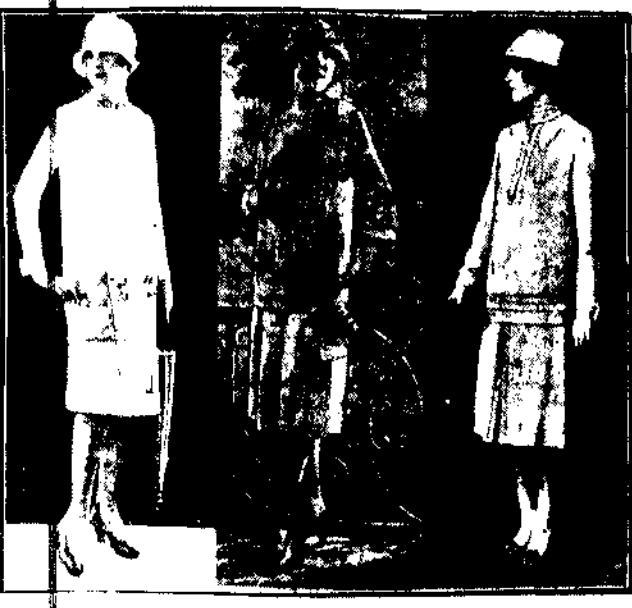
w Paryżu pojawiła się moda letnia