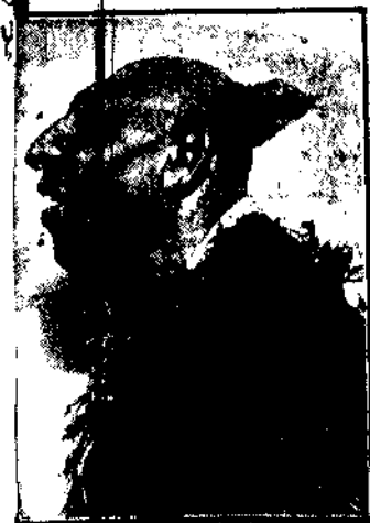
Ostatni z plemienia Azteków, budzący sensację wystąpił w amerykańskim cyrku Barnama.