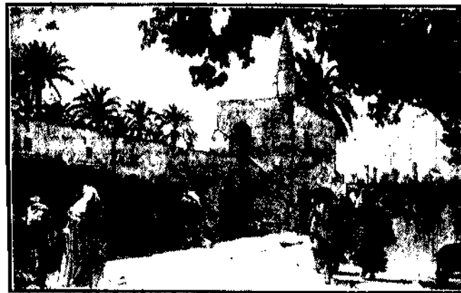
Kramy w cieniu parku.