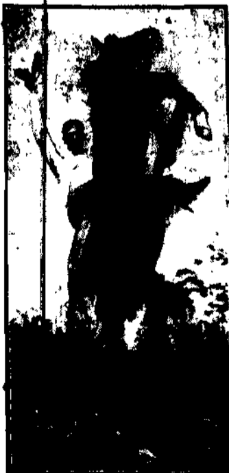
W amerykańskich wyścigach cowbojowych biega o nagrodę 10 tys. dolarów wygrał ogier „Buck”. Wspinał ten rumak jest własnością pewnego młodego cowboja ze stanu Texas. Fotografia przedstawia „Bucka” i jego właściciela, zdjętych bezopiekrednie po zwycięstwie.