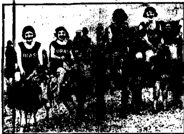
Rozbawne angielski dostady na plaży tych niezbyt racych rumaków i próba łą arzać wyszki. Czy daleko im do sąsiada — niewiadomo, wszakże osły nie darmo są osłami, których cechuje upór.