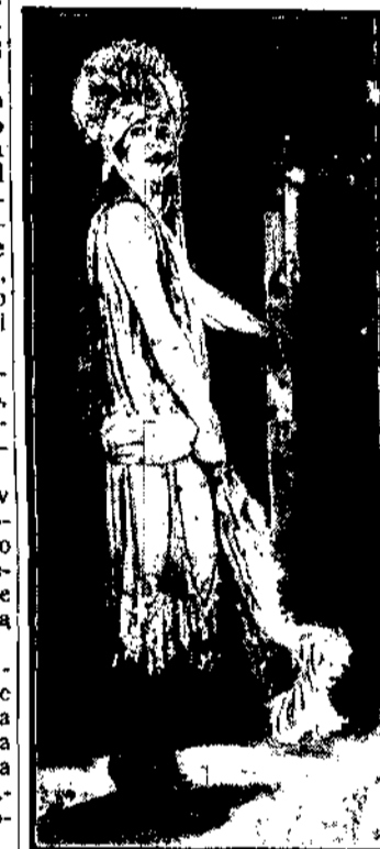
Ostatni krzyk mody paryskiej: Zorkta przybrana w pasie i w dołu srebrnym brokatem. Do kompletu konieczny jest pek piór w rekni i na głowie tiadema, z którego zwisała dwa długie sznurki, peral.