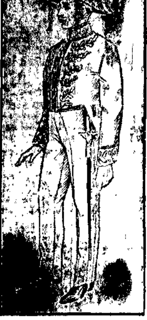
Zdjęcie powyższe przedstawia właśnie model tego stroju urzędowego.