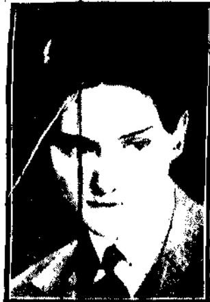
LILIAN HALL DAVIS w roli meskiej, w najnowszym filmie niemieckim, granym w Berlinie.