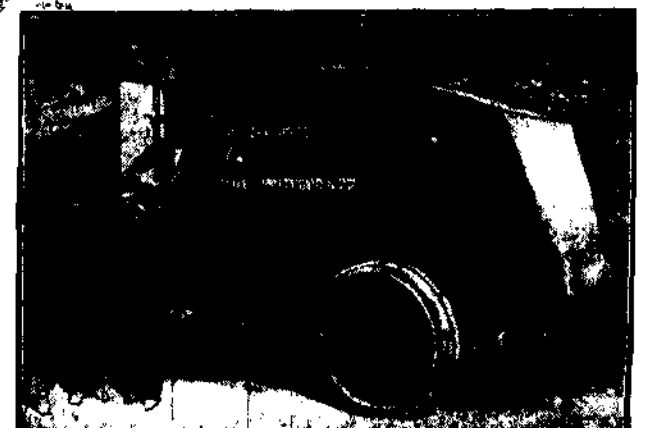
Hiszpańskie auto pancerne