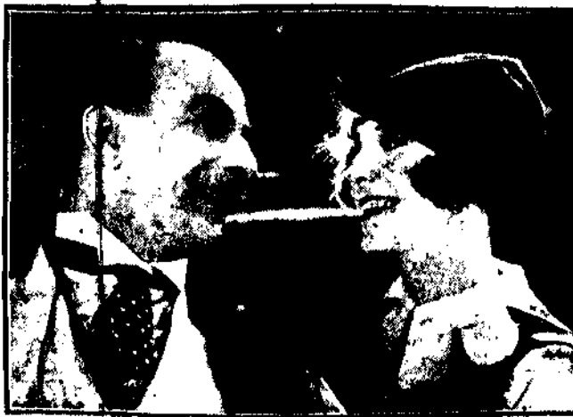
Tak brzdął tytuł najnowszego operetki amerykańskiej, w której występuje młody brytanek Nex Yorku komik Leon Errol.