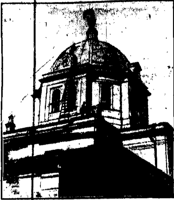
Otworzenie przedtę, jak nie w Rosji sowałektel. Rycina przedstawia moment odjęcia krzyża z jednej z cerkwi w Moskwie i zawieszenie w tym miejscu czerwonego sztandaru. Cerkiewie zamieniono na klub.