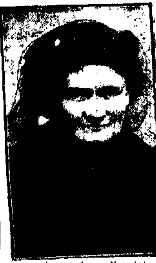
sprawczyń zamachu na Mussoliniego