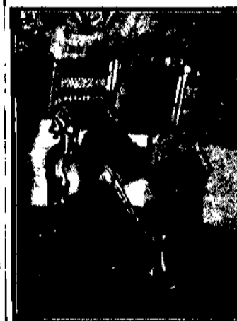
Na paryskiej wystawie zahłoków epoki średniowiecza między innymi znajduje się król Dagoberta, na którym podczas koronacji zasiadali wszyscy królowie Francji i cesarz Napoleon.