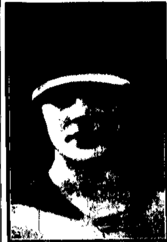
z czarnej satyny plisowanej ze srebrnym brzoźkiem.