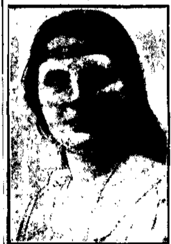
Holenderska księżniczka Juliana, córka królowej Wilhelminy, zaczęła obecnie studiować prawo i jest zdecydowa- nie skłonna wszystkie egzaminy, a może nawet zostać adwokatem. Na weseli wypadek.