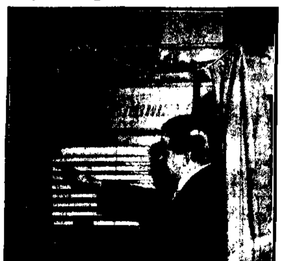
Aby uniknąć nadużyć wyborczych od których trudno się ustrzedz na- wet na Zachodzie, wynaleziono w Ameryce specjalną maszynę do głosowa- nia. Na obrazku widzimy kilka rzędów guzików do naciskania, a nad każ- dym z nich nazwisko kandydata. Wyborca wedle swej woli naciska odpo- wiedni guzik, wewnątrz zaś maszyna dokonuje się automatycznie gło- sowa- nie głosów.