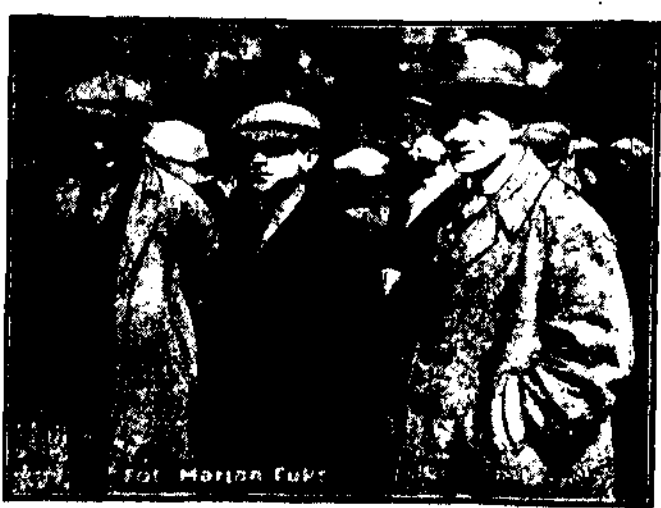
Niemogących się wyłegłymować podejrzanych odprawa do komisariatów celam wyprzedzenia osobistości.