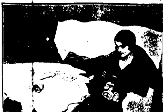
Wśród emigracji rosyjskiej w Paryżu żyła kuzynka ostatniego z carów, pracując na życie haftami, które sprzedaje następnie we własnym sklepie.