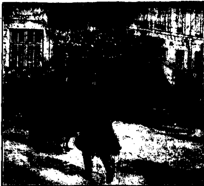
Alarm policji w Komandzie Głównej