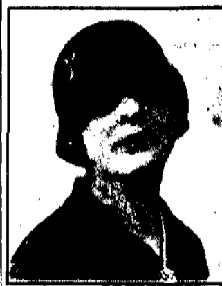
Toczek z czarnej satyny do sukni spacerowej.