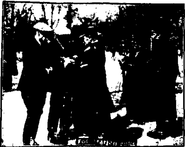
Policja dokonała obławy w Sęckim Ogrodzie i sprawdzała dane osoby.