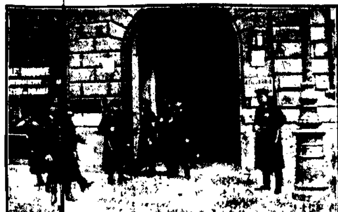
Pogotowie policji przed gmachem ministerstwa pracy i opieki społ. na pl. Dąbrowskiego w Warszawie