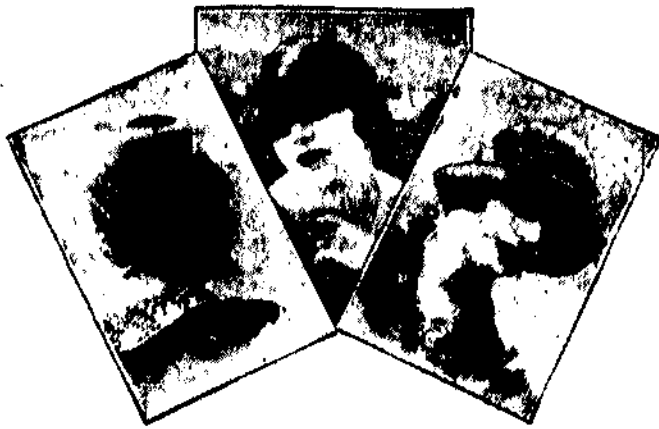
Najmłodsze modele kapeluszy wiosennych.