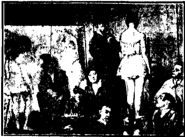
Przyszłe chluby malarstwa polskiego podczas przerwy w nauczaniu.