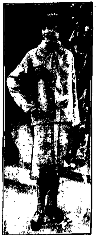
Modny kostium wiosenny.