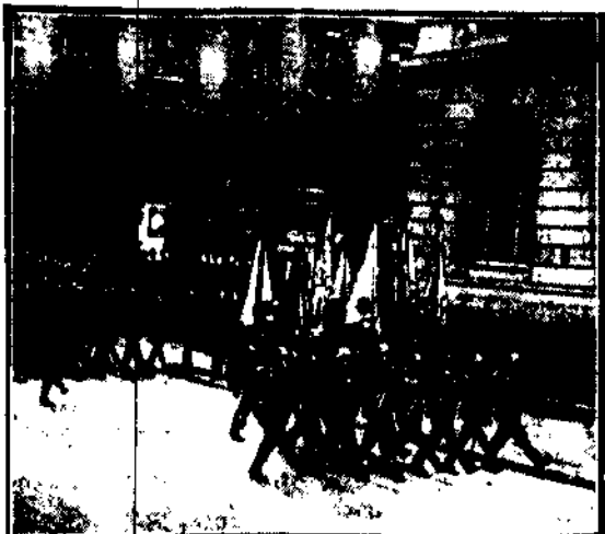
podczas uroczystości barłdzkich w rocznicę 60-letnia Hindenburga.