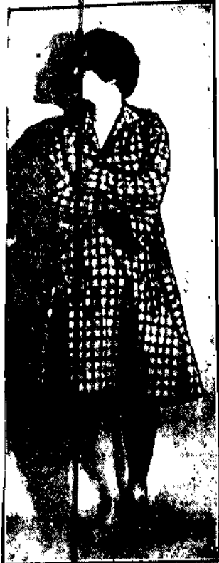
10-letnia Van Dyck z teatru Reinhardt, zyskała sławę świątecznej recytatorki.