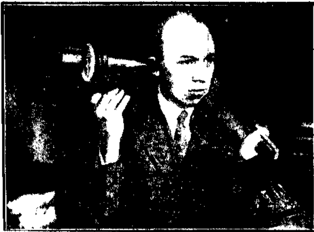
50 lat temu Graham Bell opatentował swój wynalazek aparatu, przenoszącego rozmowę na odległość. Jakże prymitywnie wyglądają dziś w naszych czasach te lejki i rury, które w ciągu pół wieku zmodyfikowały się w zgrabne słuchawki i mówki dzisiejszych telefonów.