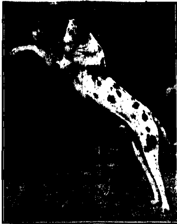
odznaczony pierwszą nagrodą na wielkiej wystawie psów w Jellings (Anglia). Obok właścicielka psa.