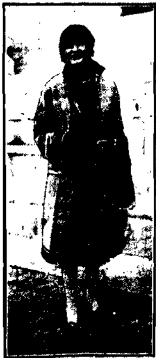
na wiosenne wyjścia w Paryżu.