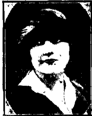
Sztywny kapelusik sportowy na rano z bezowego filcu z płótkiem białym.