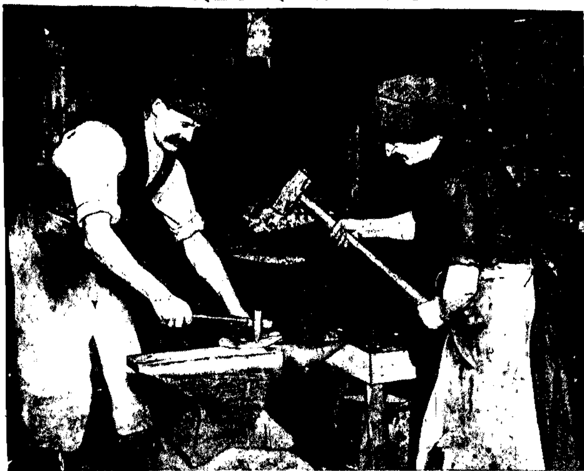
Kto pracuje przy żelazie — dowodem tego mogą być nasi górnośląscy — ten nie tylko hartuje swe siły fizyczne, ale i swą wolę, ten umie „praczyć w czynów stal” — jak mówi poeta. Kuznie w Polsce słynęły z przekuwania łomieszy na miecze w czasach zamierzchłej przeszłości. W czasie Resur-rekcji przekuwali kowy dla krakusów, a w ostatnim powstaniu górnośląskim, którego płacą rocznicę obecnie obchodzimy, dali najlepszych wojaków. Tam gdzie kowale i hutnicy odeszli na front, miejsce ich przy kowadle zajmowały kobiety i kuty dalej „czynów stal”.