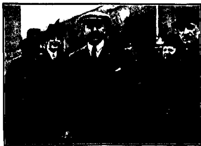
Premier Skrzyński witany na dworcu warszawskim przez przedstawicieli rządu. Od lewej ko prawej: min. St. Grabski, w. min. Morawski, premier Skrzyński, min. Ostęcki i min. Raczkiewicz.