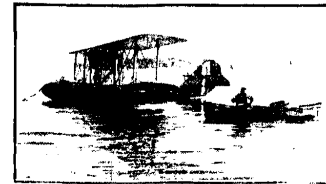
Hydroplan, który widzimy na ilustracji służy do pilnowania granicy.