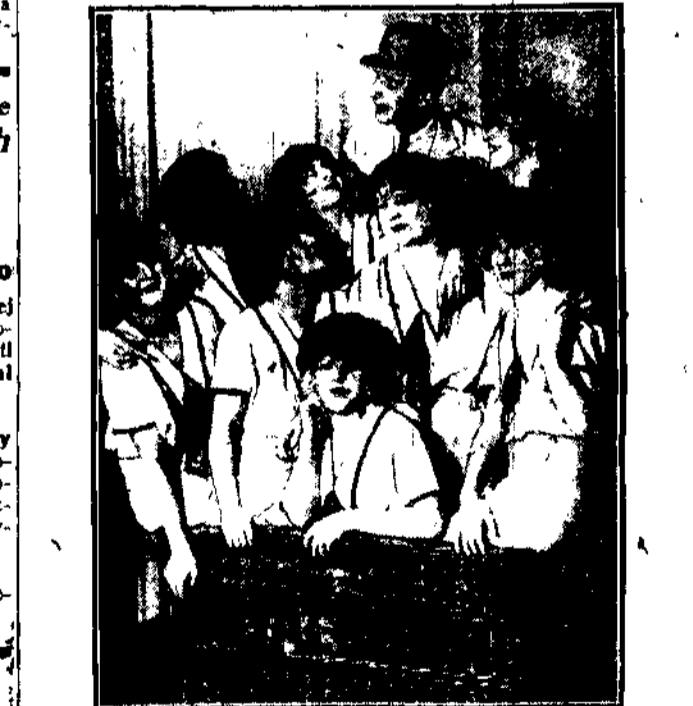
Do Wiednia zawitała w ostatnich dniach grupa rozkosznych i s. „Jackson-girls” występujących w śmiesznych i oryginalnych ewolucjach tanecznych.