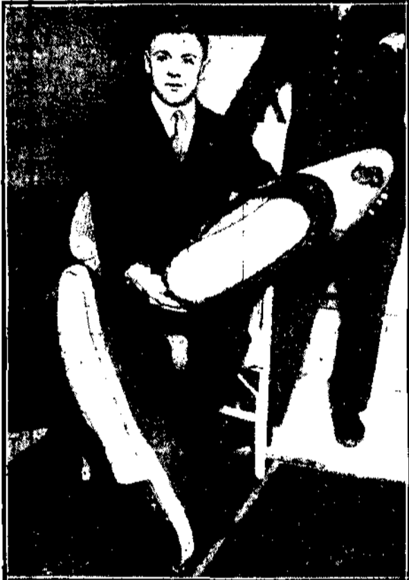
Na wystawie szewskiej w Lipsku, otworzonej przez prezydenta Hindenburga, wystawiono parę pantofli - olbrzymów.