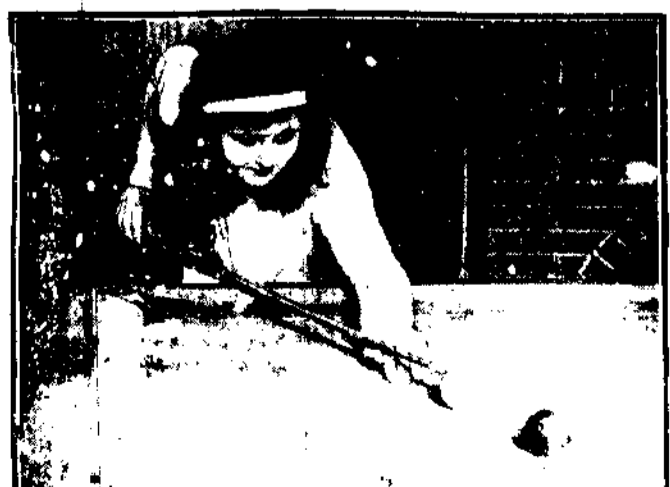
Znakomita tenisistka amerykańska, miss Betty Nuthall, tu erdzi, że najlepiej gra w tenisa na bilardzie.