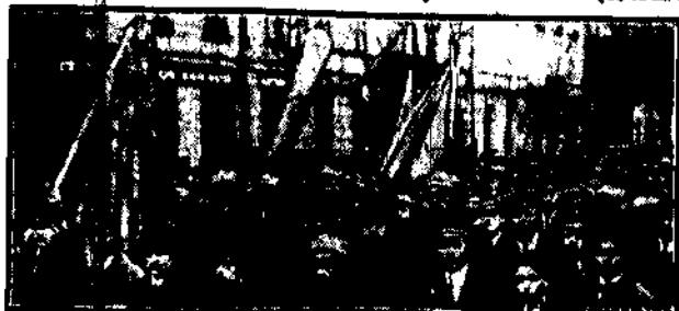
Manifestacyjny pochód młodzieży akademickiej po wczorajszym wieczu w Filharmonii