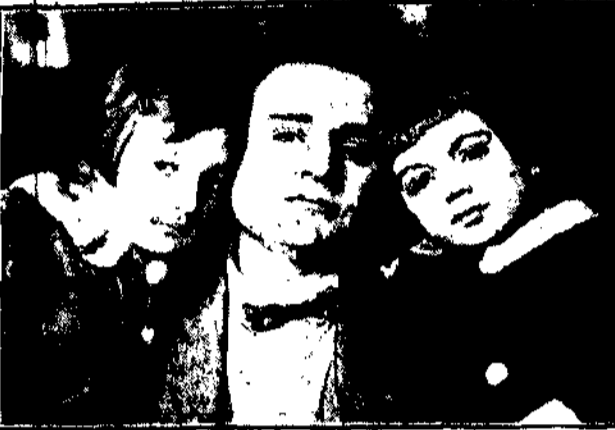
Znakomity tenor opery Metropolitan w Nowym Jorku, Benjamin Gilg, przetrwał swe występ uskutkiem groźby mafii „Czarnej Camorry”, że o ile dał sobie spłacić — przypłaci swój upor śmiercią. Gilg, którego widzimy na fotografii wraz z dziećmi swymi, wyjechał do Detroit, gdzie silne posterunki policyjne strzegą go przed zamachem.