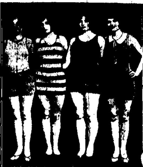
Kostiumy kąpielowe w najbliższym sezonie

nie można jej było skłonić żadną perswazją do szukania pomocy u lekarza.