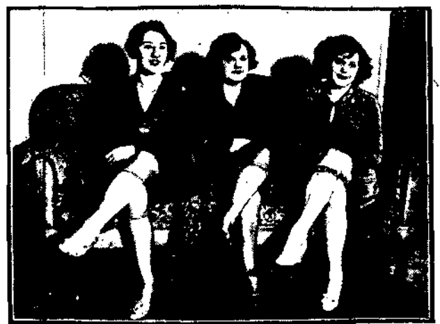
Na nowo orkłej wystawie przemysłu podwiązkowego zwrócili uwagę poszczególni publiczności trzy przekształcone podwiązki ozdobione perłami i droższymi kamieniami. Wartość każdej obliczona na 20.000 dolarów.