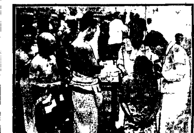
Na ulicach Tokio lekarze japońscy szczerpią zachwycając wzorową czystość i porządek.