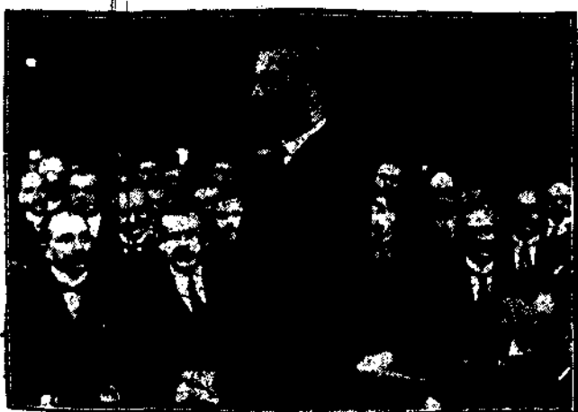
Min. spraw wewnętrznych (Patrz str. 3.)