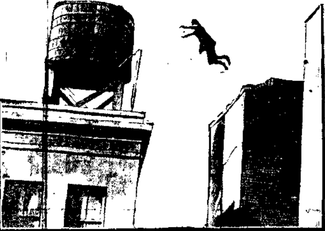
W Nowym Jorku znaczna część bezrobotnych obywateli zarabia na życie w ten karkołomny sposób.