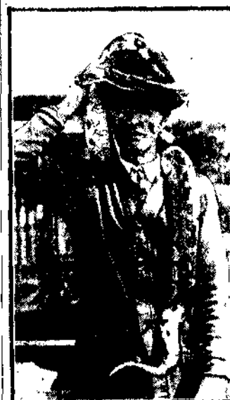
Pogromca zwierząt z swego 3-metrowego pytona tworzy efektowną, choć niebezpieczną koronę.