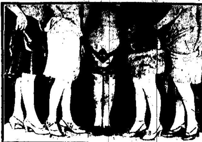
W światowej stolicy wytwórni filmowych, Hollywood odbył się niedawno tysięczny i pierwszy konkurs nóg. Na ilustracji widzimy pięć artystek promowanych.