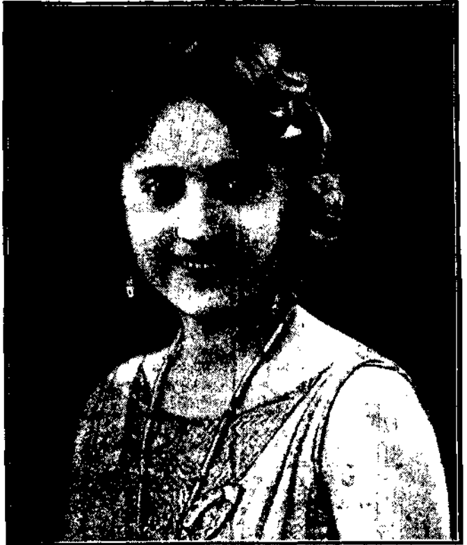
Skrómna, choć kosztowna biżuterja należy obecnie w świecie przesyć do dobrego tonu.