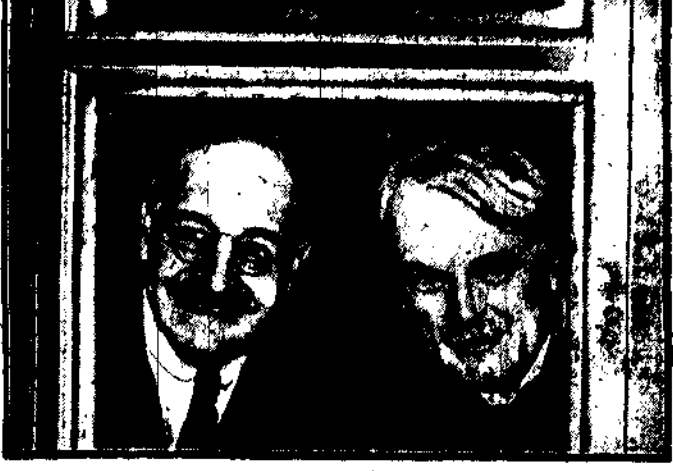
ALFRED MOND I LLOYD GEORGE w chwilach przyjaźni. Obecnie Sir Mond po przyjęciu przez partje liberałów radykalnego programu rolnego Lloyd George'a opuścił szeregi partji i wstąpił do konserwatystów.