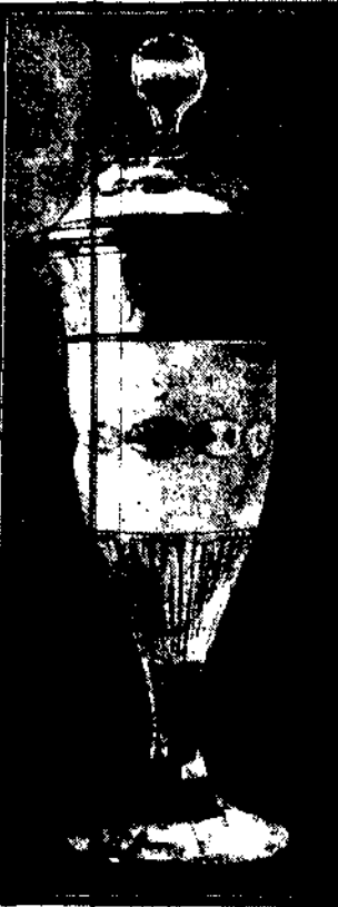
Patrol narciarski 3 pułku strzelców podhalańskich zdobył na ostatnich międzynarodowych zawodach narciarskich w Czechosłowacji II nagrodę — puchar kryształowy.

Warszawa — Turcja na czele. Tabor wysłany sekcji posiada dość obfity: 14 dobrze utrzymanych, lecz niestety nie najnowszej typu lodzi. Gorzej jest z taborami treningowym (tylko 7 lodzi) i spacerowym, które nie wystarczają dla licznie pracujących do sportu wodnego akademików. W chwili obecnej sekcja wioślarska liczy 767 członków. Największą bolączką sekcji i klubu, o kwestji przystąpienia stała: teren obok przystani warsz. Tow. wioślarskiego, magistrat pragnie odebrać A. Z. S-owi. Byłaby to niestety krzywdą wyrządzoną młodzi akademickiej, która wielkim wysiłkiem zdobyła jako tako urządzenie przystani i zabierała się w r. b. do solidnego jej zagospodarowania. Drużyna „podpora” klubu to sekcja lekkoatletyczna, posiadająca obok sekcji Polonii, wielkie zasługi w rozwoju tego sportu w stolicy. Tymczasem lekkoatletyczna się w balach krytych pod kierunkiem znakomitego trenera — Szwecka, Norlinga. W połowie marca zawodnicy wyjadą na biegnię; w końcu marca urządzi