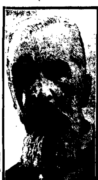
Mr. Apponyi, kandydatem na regenta Węgier po przewidywanym ustąpieniu adm. Hortyego skompromitowanego alera fałszerzy franków.