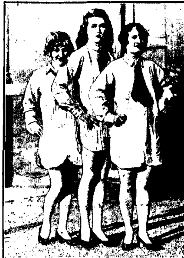
Na ciepłych brzegach południowej Kalifornii, kąpacie się Amerykanki używają kostjumów kąpielowych, skrojonych na wzór koszuli męskiej. Jak widzimy, moda „chłopczycomanii” rozwija się błyskawicznie.