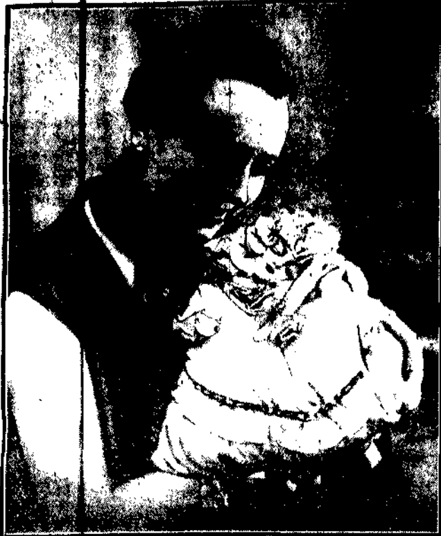
Paris zszedł na rynek nowe kreacje lalek. Lalka ma obecnie przypominać śpiącą dziewczynkę. Znakomitemi mają być główka i nóżki — reszta winna tonąć w jedwabnych albo zdobionych powłokach. Srebrzysto — biała barwa uchodzi za najmodniejszą. Jest to dalszy etap zaniku macierzyństwa.