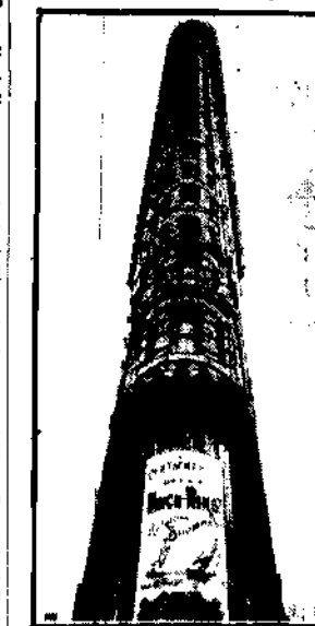
Nowy Jork szczyci się tym „drapaczem chmur”, wzniesionym na narożniku dwu ulic. Gmach ten nie należy bynajmniej do najwyższych w metropolii Stanów Zjednoczonych, ze względu jednak na szczupłość swej podstawy stanowi cudo techniki budowlanej.