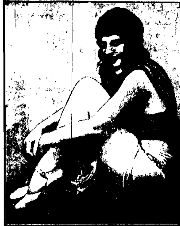
W amerykańskiej stolicy filmowej, Hollywood odkryto wśród tysięcy kobiet młodszą kalifornijkę której kształty ciała odpowiadały jaknajściślej greckiej klasycznej rzeźbie. „Najdoskonalsza kobieta świata” — jak ją orasa amerykańska opinia — wstąpił niebawem w te dny z filmów najbliższych.