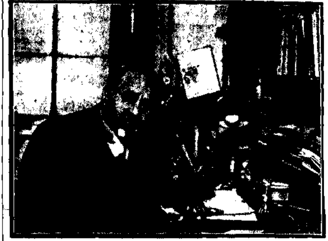
PROF. ALBERT CALMETTE, dyrektor paryskiego Instytutu dr. Pastoura, wynalazca szczepionek ochronnych przeciw gruźlicy przy pracy.