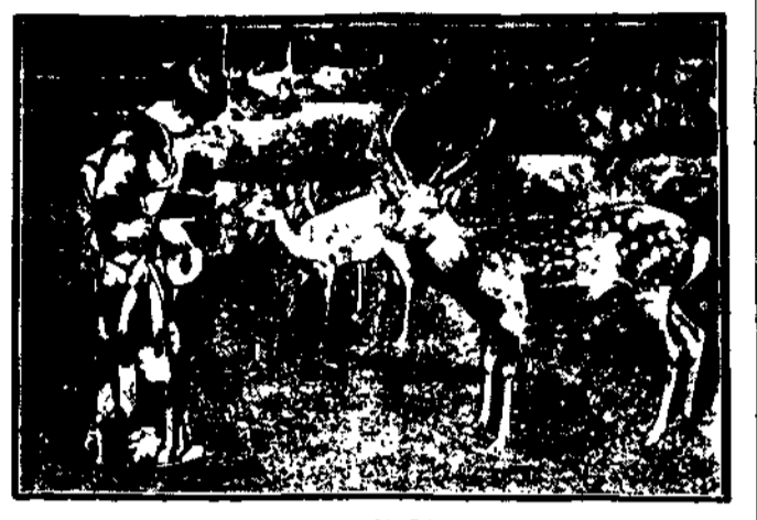
W NARA POD TOKIO