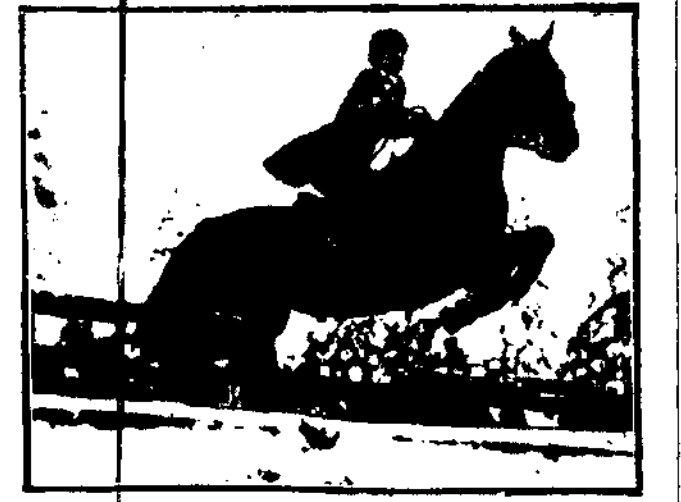
SZWEDKA I PŁODUJIST wzięła pierwszą nagrodę podczas zimowych popisów hipicznych w Szwedzkiej Białej.