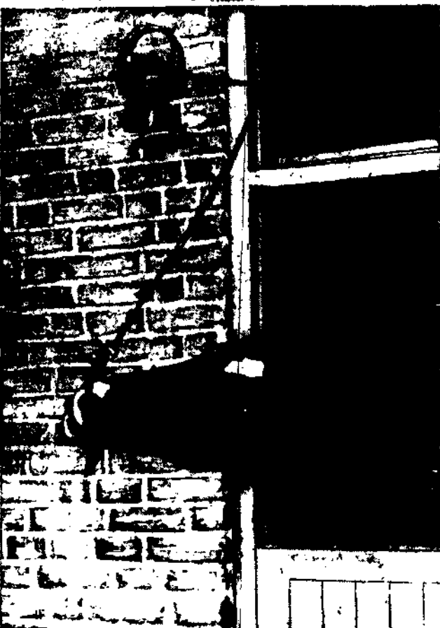
W jednym z majątków angielskich koń podpatrzył, że o pewnej godzinie za pomocą dzwonka musiał zjechać się na morze stajni, zwolną służbę i zaczął i wtedy konie również otrzymują posiłek. Mądry koń zaczął wpatrywać się w dzwonka, a czynił to z taką punktualnością, że z czasem zaczął...