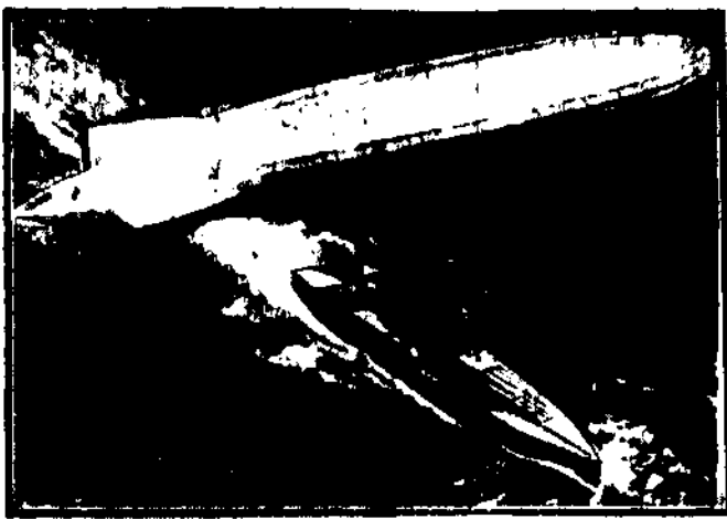
Wielki starowiec transatlantyki typu Zepelina, który przez okno widać w obrazie przyszłości, — marzenie.