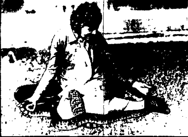
Młoda amerykańska uczona hoduje w celach naukowych różne odmiany węzów. Na fotografii widzimy amerykańkę zabierającą się ze swoimi wychowanymi.