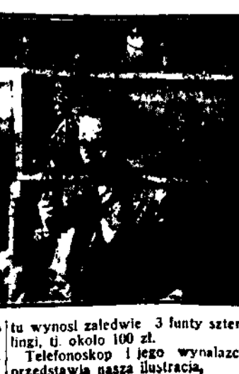
tu wynosi zaledwie 3 funty szterlingi, tj. około 100 zł. Telefonoskop i jego wynalazcę przedstawia nasza ilustracja.

Epokowe wynalazki do kłonił świat do Anglik. J. H. Baird. Jest to aparat, pozwalający nie tylko mówić na odległość i słyszeć, ale także widzieć. Wynalazek ten jest tem cenniejszy, że jest dość prosty, nieskomplikowanej konstrukcji, działa podobno doskonale, a do najważniejszych — jest bardzo tani, gdyż koszt aparatu wynosi zaledwie 3 funty szterlingi, tj. około 100 zł.