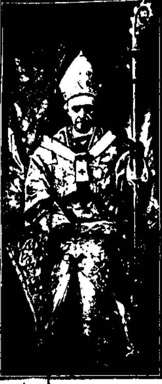
BRUKSELA, 23.1. — Godzina 3 po poł. — kardynał Mercier zmarł.

Narodowy bohater Belgii KARDYNAŁ MERCIER zmarł wczoraj w Brukseli