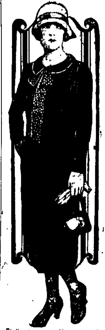
Wielkie firmy parwskie opracowały już modę sukien damskich na nadchodzący sezon letni. Jak widzimy, tegoroczna moda nie będzie miała zbyt wielkich wynagań a stroje kobiety cechować będzie skromność.