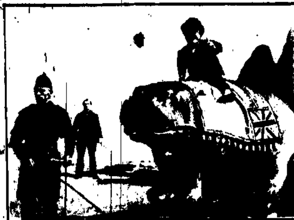
W wielkim cirku Szarszatego po pisuje się świetnie tresowany hipopo-tam, nazywany „Edypem”. Na fotografii widzimy wspaniały okaz hipopotama z kłownem — ka-żdekim na grzbiecie.