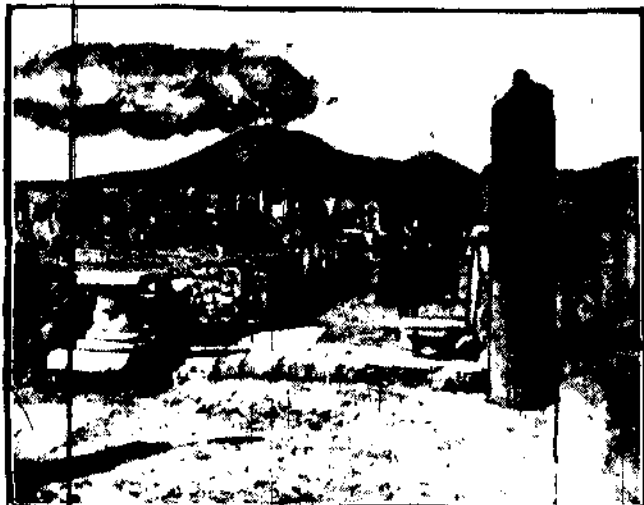
Widok Wezuwiusza od strony Pompei.

WARSZAWA 9. I. NOTOWANIA POŁUDNIOWE Metal Rubel złoty 424. Dolar złoty 815. Funt ang. złoty 3900. Dolar srebrny 656. Rubel srebrny 287. Srebrny bilon rosyjski 123. Dewizy Berlin 195. Belgja (za 100) 37 1/2. Holandia (za 100) 327 85. Londyn (za 100) 3955. Paryż (za 100) 3150. Praga (za 100) 2425. Szwajcaria (za 100) 15700. Sztokholm (za 100) 219 75. Włochy (za 100) 3320. ZURICH 9. I. Zamknięcie Warszawy 6500. Paryż 1977. Londyn 25117. Akcje B. Polski 55,00. B. Dyskutowy 535. S. Handlowy 200. B. Zjednoc. 100. B. Sp. Zar. 400. Pol. Tow. P. 605. Chłodoń 545. Czernk 622. Częstochowa 285. Gostawice 115. Warsz. Cukier 190.