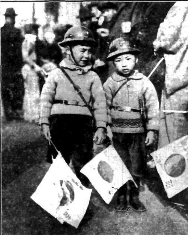
Ostatnie wypadki wojenne japońsko - chińskie wpłynęły na militarzację dzieci japońskich. Codziennie oglądać można chłopczków japońskich w stroju wojskowym, witających zapomocą chorągiewek powracające wojska.