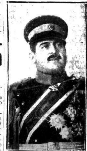
B. premier Žiwković

od autobusów po 36 zł. od 100 kg., od taksówek po 35 zł. od 100 kg. Od samochodu ciężarowego służącego do własnego użytku po 33 zł., od samochodu ciężarowego, użytkowanego w celach zarobkowych po 40 zł. Wreszcie od motocykla bez przyrządów 50 zł. od sztuki i z przyrządami po 75 zł. od sztuki.