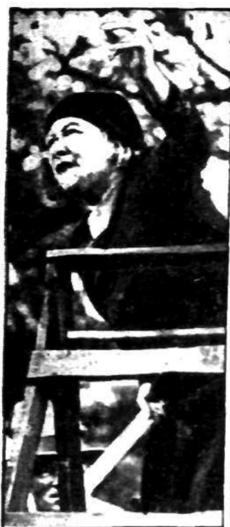
Słynna sufrażystka pani Pankhurst wciąż walczy o prawa kobiet (do art. obok).

Przed ćwierćwiekiem żywym symbolem walki o prawa kobiece była pani Pankhurst, twórczyni i przywódczyni emancypacyjnego ruchu sufrażystek. Walczyła o prawa kobiet, które w tym czasie były jedynie domowymi niewolnicami i wśród których wyjątkiem były te, co ośmielały udać się na wyższe studia, lub zająć jakieś „męskie” stanowisko.