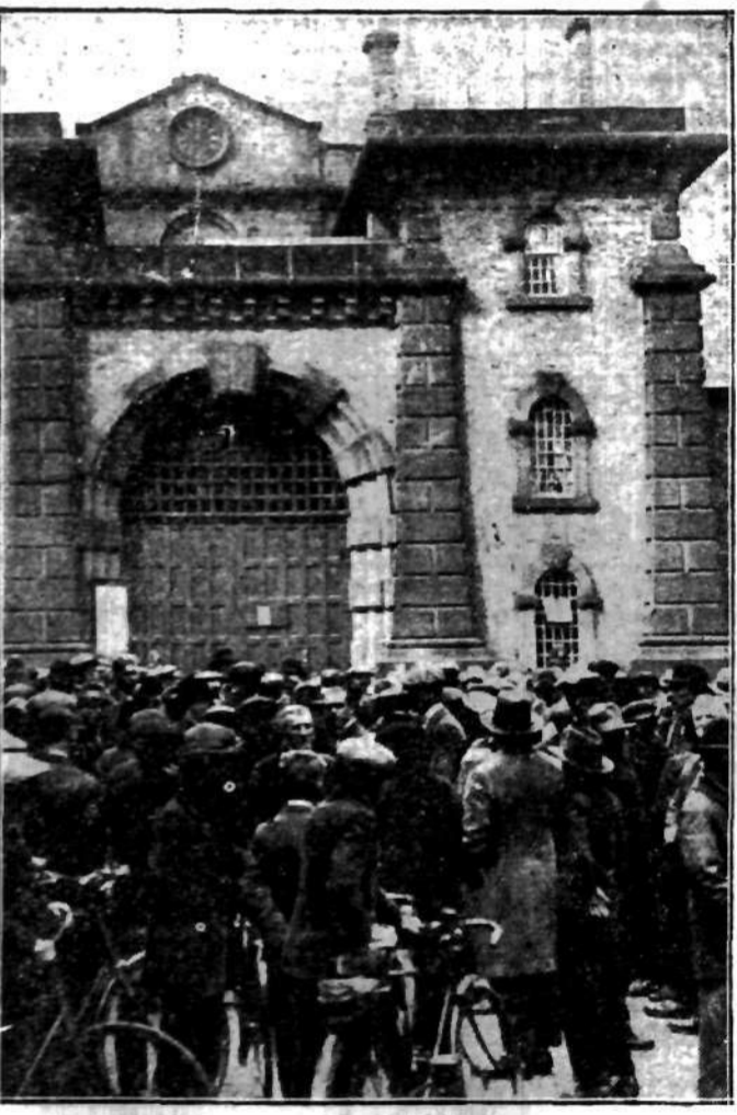
Niespokojny tłum u wrot więzienia w Dartmoor.