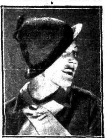
Niezwykle oryginalny kapelusz ze słomki chabrowego koloru.