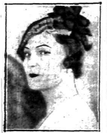
Wiosenny kapelusik, przypominający modę naszych prababek.