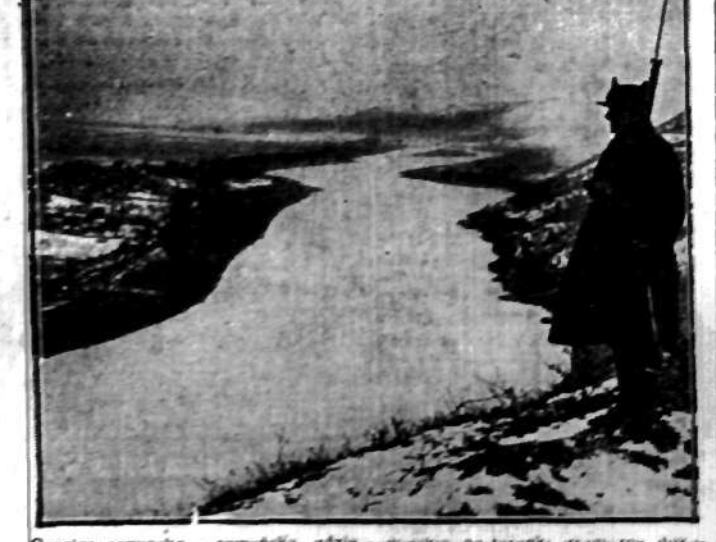
Granica sowiecko-rumuńska, gdzie sowieckie posterunki graniczne dokonywały ostatnio krwawej masakry chłopów, przekradających się przez granicę z Sowiec do Rumacji. Na pierwszym planie widoczny graniczny wartownik rumuński.