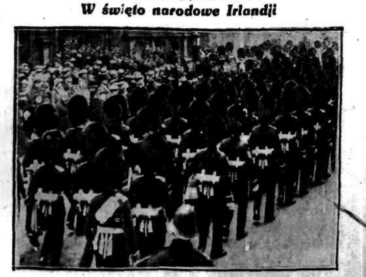
Dzień Sw. Pátryka (17 marca), patrona Irlandji jest obchodzony niezwykle uroczysto w całej Anglii. Na zdjęciu przemarsz gwardji irlandzkiej przez ulicę Dublinu na uroczyste nabożeństwo.