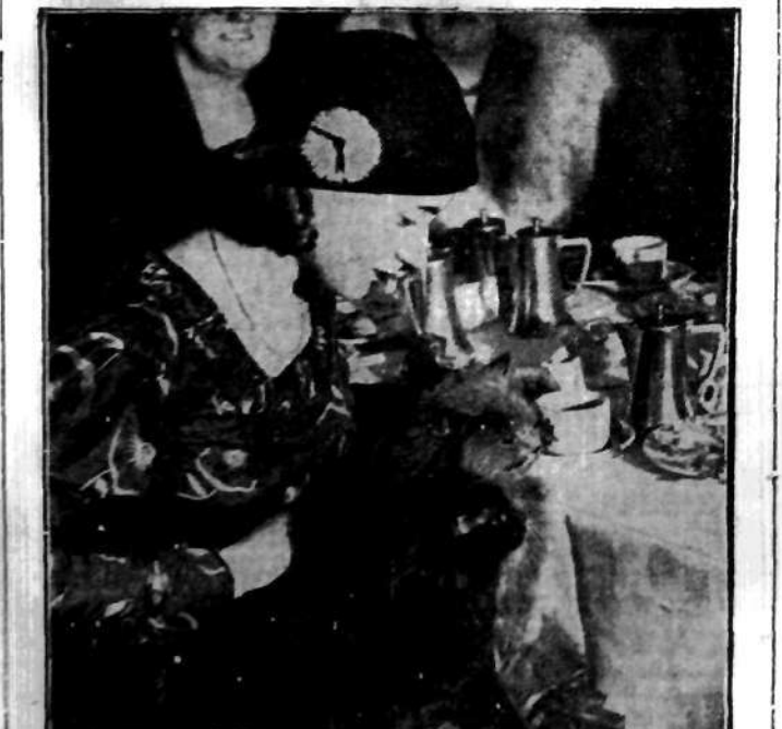
Para przepięknych perskich kotów, jeden czarny, drugi błękitny — towarzyszą swej uroczej pani przy kawie.