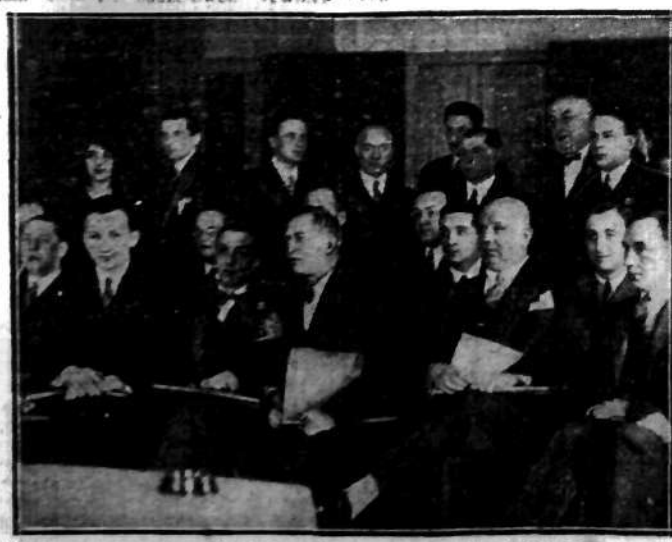
Wczoraj rozpoczął w Warszawie obrady doroczny zjazd Związku artystów