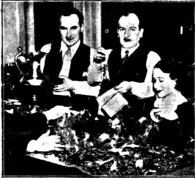
Stosy przedmiotów złotych, wykupione od obywateli angielskich, przeznaczone do przetopienia na sztaby złota dla Banku Angielskiego.