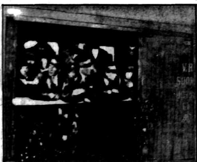
Grupa członków organizacji... w Helsinkach...