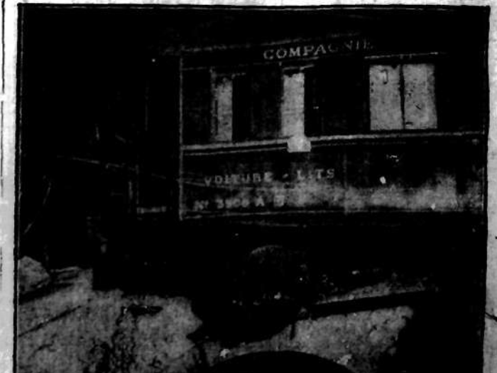
Wykolejony wskutek zamachu bombowego między Marsylią a Tulonem pociąg błyskawiczny, kursujący na linii Vintimiglia - Paryż. W chwili wybuchu bomby pociąg szedł z szybkością 90 km. na godzinę