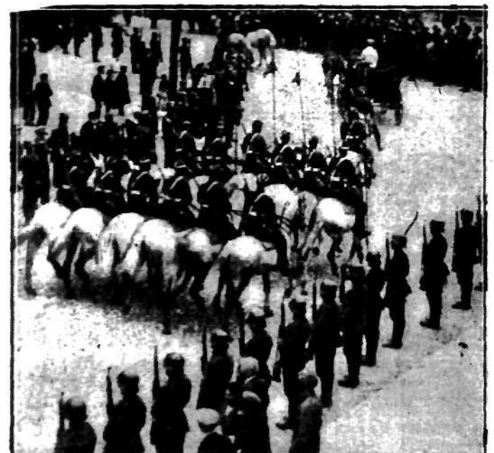
Przejazd prezydenta litewskiego, Sime tony, przez ulice Kowna na rewję państwową, która odbyła się niedawno w dniu święta państwowego Litwy.