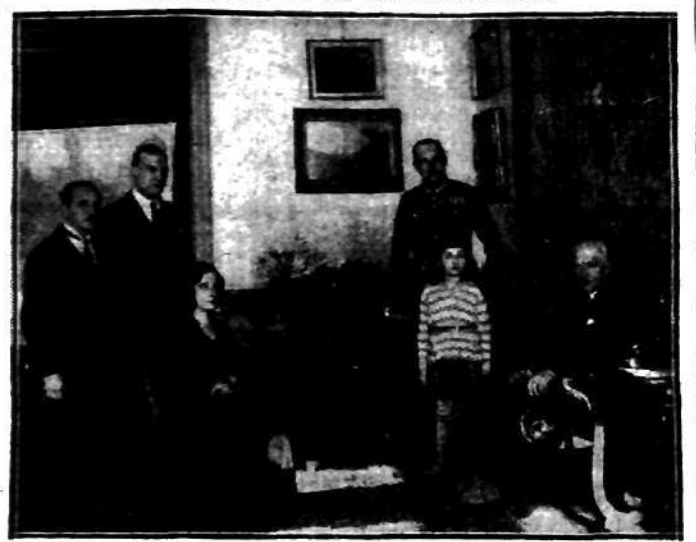
Pan Prezydent przyjął onegdaj delegację zrzeszenia b. członków P. O. W. — Wschód (K. N. 3), która wreczyła Mu z okazji imienin popieranie Marszałka Piłsudskiego.