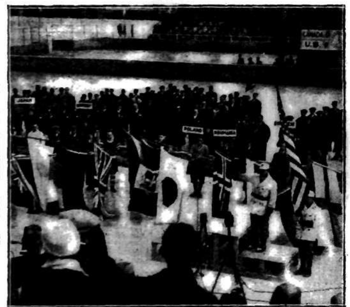
Dopiero teraz dochodzą do nas zdjęcia z Olimpiady zimowej w Lake Placid. Zdjęcie przedstawia chwilę uroczystej przysięgi olimpijskiej, w obecności wszystkich zespołów sportowych, biorących udział w zakończonej niedawno Olimpiadzie zimowej w Lake Placid. Zaznaczona strzałką stoi polska drużyna narciarska i hokejowa. Przysięgę składa popularny lotnik i podróżnik — komandor Byrd.