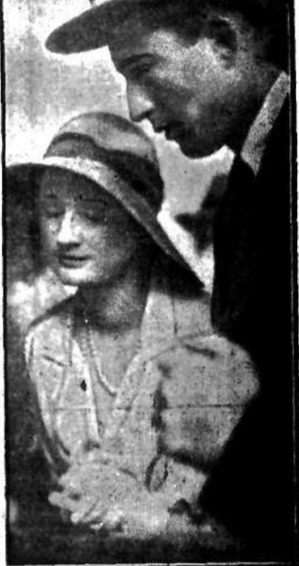
Następca tronu Belgji, ks. Leopold z małżonką ks. Astrid w czasie zwiedzania jednego z muzeów Kairu.