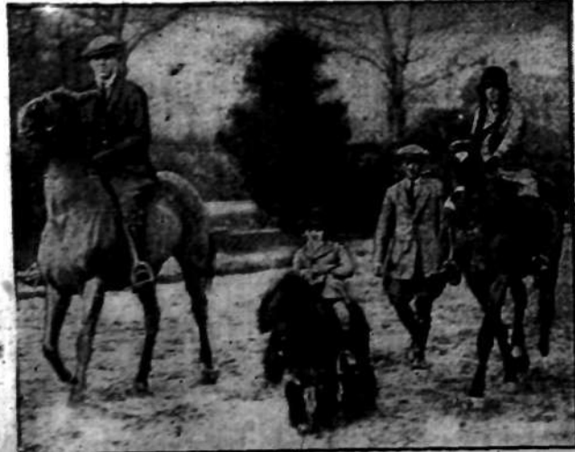
Łaputów sprowadzonych z wysp Szetlandzkich, używanych do nauki jazdy konnej dla dzieci w Seltou w Liverpoolu.