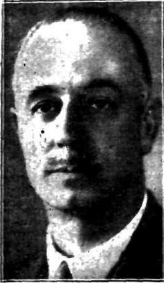
długoletni generalny sekretarz Ligi Narodów, który na ostatnim posiedzeniu Rady Ligi zgłosił rezygnację ze swego stanowiska.