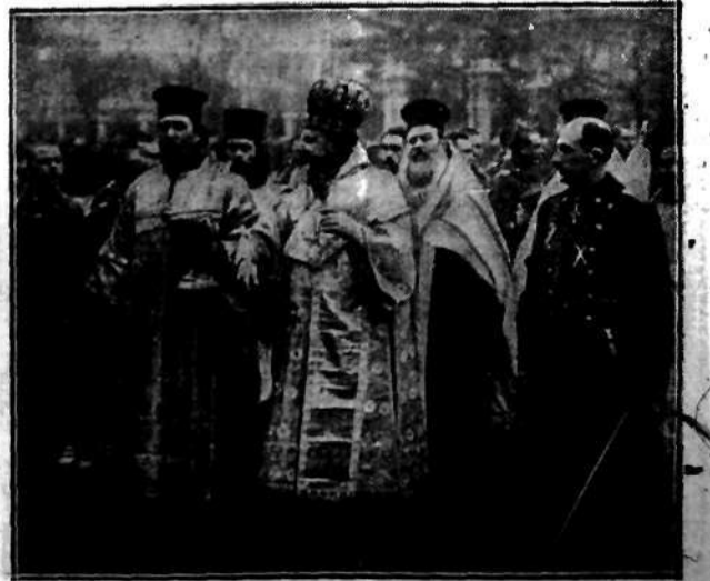
Król bułgarski Borys (x) podczas uroczystego obchodu święta Jordanu w Sofii