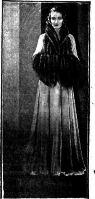
Ten biały aksamitny płaszcz wieczorowy, przybrany nerkami, otrzymał pierwszą nagrodę na jednej z rewii mód.