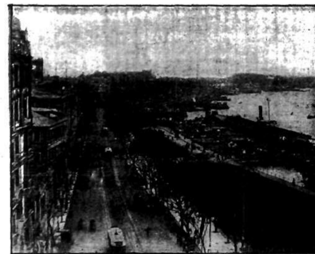
Ulica portowa w okupowanym przez Japończyków Szanghaju, wielkim porcie nad rzeką Hoang-Pu, znanego z ogromnego handlu europejskiego.