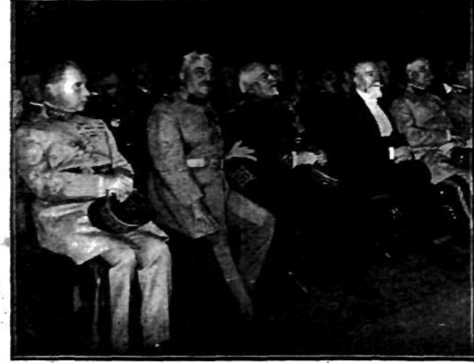
W obecności prezydenta Francji Doumera oraz licznych dygnitarzy wojskowych wyświetlono film, przedstawiający dzieje słynnej szkoły wojskowej w Saint-Cyr.