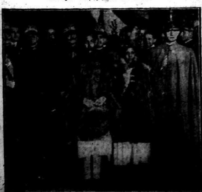
Abiyehinik następcą tronu Afstady Wessan w podróży swej po Europie przybył do Rzymu.