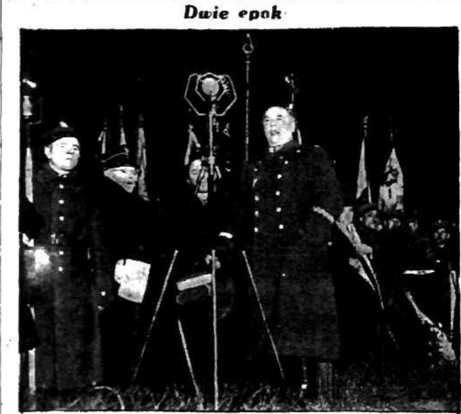
Gen. Galica wygłasza przez radio płomienne przemówienie na cześć powstanców 63-go roku.

Trzej złodzieje, o ile nie umrą wskutek smutnego nieporozumienia, staną przed sądem.