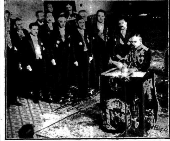
Król Jugosławji Aleksander wygłasza przemówienie tronowe z okazji otwarcia senatu i Skupczyny w Jugosławji.