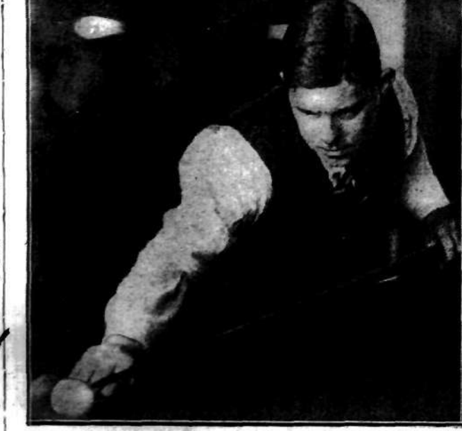
Australijski mistrz bilardu Lindrum zdobył w Londynie nowy rekord światowy