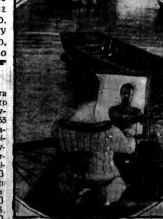
Przed słynnymi regatami uniwersyteckimi Cambridge - Oxford, osada Oxfordu trenuje przed lustrem umożliwiając obserwację błędów.