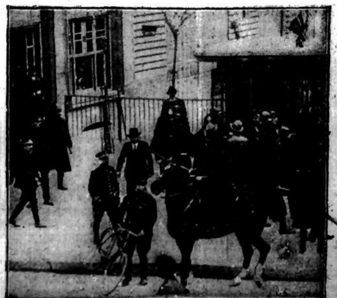
Polcja hiszpańska zajęła rozpedzaniem demonstrujących robotników w Barcelonie.