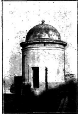
Budowa starożytna; pozostałość z czasów rycerzy maltańskich w La Valletta na Malcie

W przeddzień przyjazdu przybył na „Iskrę” oficer łącznikowy i tenant komandor Weble, który był