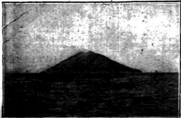
Wyspa Stromboli z dymiącym wulkanem na morzu Śródziemnym.

Po szeregu wycieczek w okolice Neapolu odkotwiczyliśmy z portu 21 lipca wieczorem i po wyjściu z portu wzięliśmy kurs na południe, kierując się do cieśniny Messyńskiej.