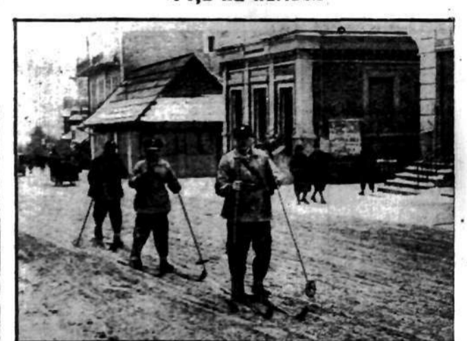
Patrol policyjny z Zakopanem pełni służbę na nartach.