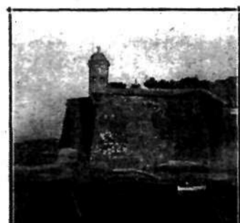
Fragment starego portu La Valletta na Malcie.