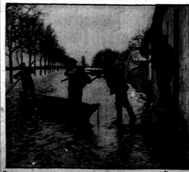
Zaszczożona przez gwałtowny przybór rzeki Mudy ludność podmiejskiej m. Dessau, ratuje swój dobytek domowy.