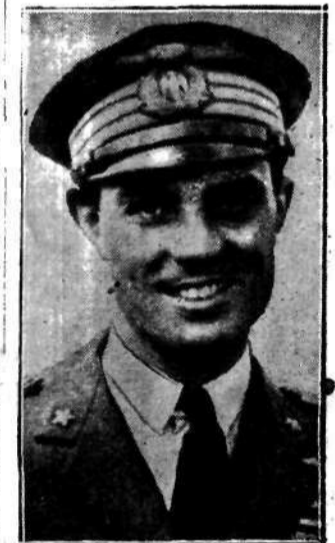
As lotnictwa włoskiego kpt. Ferrarini, który zginął w tych dniach w katastrofie samolotowej.