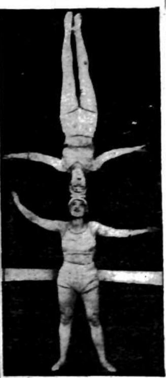
Siostry - akrobatki Lupieaz popisują się bajeczną gimnastyką w cyrku londyńskim.