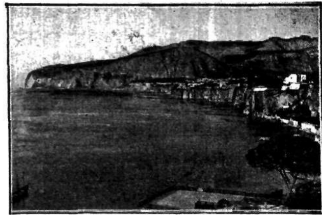
Słynna z piękności zatoka i miasto włoskie, Sorrento pod Neapolem.

naszym nieodłącznym towarzyszem i doradcą podczas całego postoju „Iskry” i zwracając się do dowódcy w serdecznych słowach, ofiarował dla „Iskry” srebrny model żaglowca, przedstawiający miejscowy typ łodzi. Wzajemnie dowódca polecił jednemu z oficerów ofiarować komandorowi duże srebrne pudełko do cygar, a poza tem osobście podziękował mu za jego serdeczny stosunek do „Iskry”.