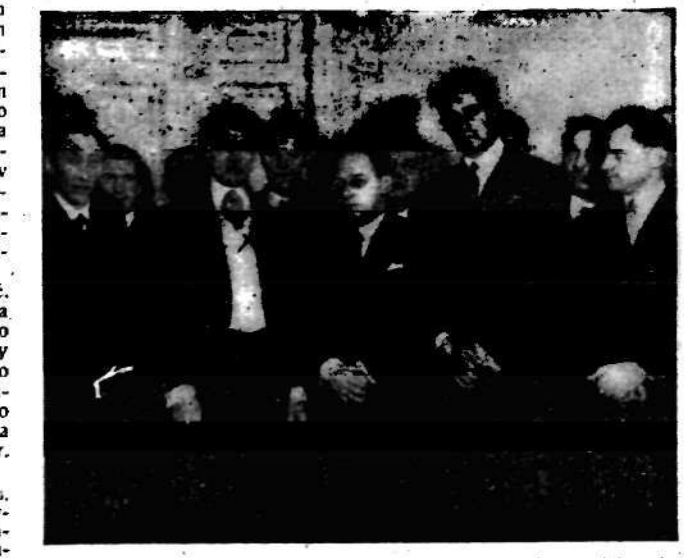
Wczoraj ks. Ghika, rumuński minister spraw zagranicznych, przyjął na konferencji prasowej dziennikarzy warszawskich.

Minister spraw zagranicznych ks. Ghika przyjął wczoraj w swym apartamencie w hotelu Europejskim przedstawicieli prasy polskiej i korespondentów prasy i agencji zagranicznych. Zebranie było wyjątkowo liczne ze względu na wagę, jaką przypisują wycieki kierownictwa polityki zagranicznej w Polsce wobec toczących się rokowań o pakt nieagresji z Sowietami i będących na porządku dziennym innych zagadnień międzynarodowych. Wyraz wsiły na wstępie radości z bezpośredniego kontaktu z prasą na ziemi polskiej daje mu okazję do potwierdzenia gorących uczuć przyjaźni, jaką naród rumuński żywi do narodu polskiego, m.in. Ghika zaznaczył, iż poznał min. Załęskiego w czasie jego wizyty w Rzymie, a jesienią sesja Ligi Narodów w r. 1931 dała mu