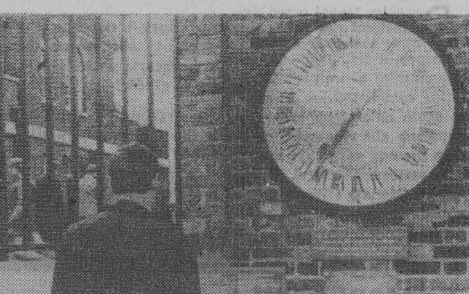
NA ZDJĘCIU: 24-godzinny zegar na ścianie obserwatorium.