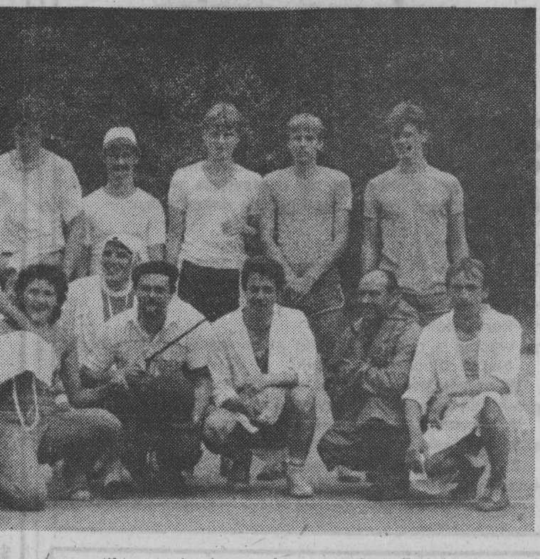
Pamiętkowe zdjęcie po meczu piłki nożnej mieszanych reprezentacji Rady Pedagogicznej i klasy IV a rolniczej.

Harcerski turniej piłkarski. To była prawdziwa uduchowa porażka sportowego lata. Dwa dziecięta zespołów, ponad dwustu uczestników, emocje i niekiedy niezły poziom.