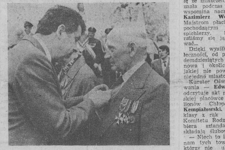
Sekretarz KC PZPR — Zbigniew Michałek dekoruje Bronistawa Chromego obelisk na wysokość blisko 30 m. Granit i metal na tle wiosennego nieba i pierwszych majowej zieleni brzoż riazanieckiego parku... na głównym poziomie — polerowany blok z czerwonego granitu z gałką laurową i słowami: „Ku chwale polsko-radzieckiego braterstwa broni”.