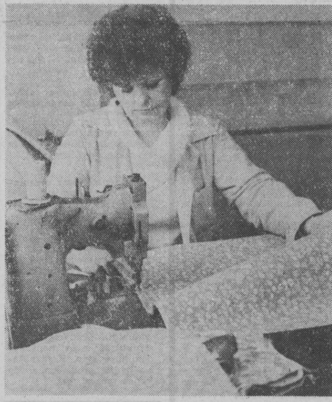
Początkowo z intruzem usiłowali się uporać pracownicy służby oczyszczania miasta, którzy okazali się bezradni. Straż pożarna i policja przystąpiła do operacji fachowej: po zakneholowaniu krokodylowi groźnie wyszczerzone paszczy, gada obeckadniono i odstawiono do najbliższego akwarium w ogrodzie zoologicznym.

KROKODYL W SEKWANIE Strażacy parcyse mieli do wykonania nie lada trudne zadanie: wyłowić z nurtu Sekwany młodego krokodyla. Zwierzę mimo swego młodego wieku zachowywało się bardzo agresywnie. Dostrzeżono je w pobliżu Ławru.