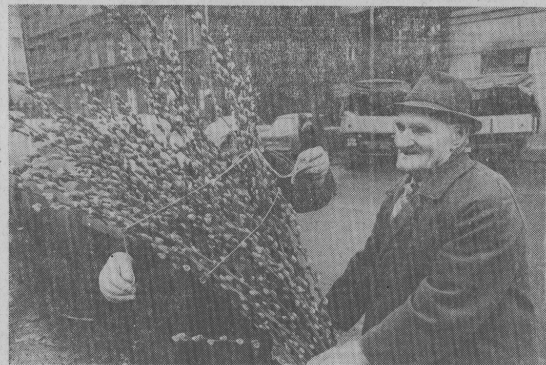
Zbliża się rolnicza wiosna

Biorąc pod uwagę zarówno potrzebę pełnego zaangażowania związku w kampanii wyborczej do rad narodowych i w obchodach 40-lecia PRL Rada Naczelna postanowiła zwołać VII Krajowy Kongres Związku — w maju 1985 r., w 40 rocznicę zwycięstwa nad faszyzmem.