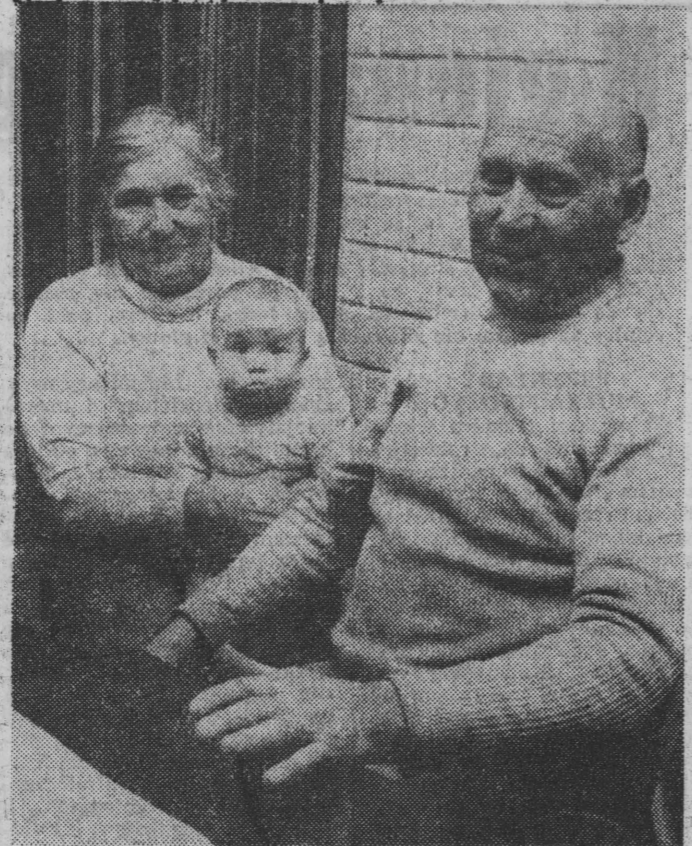
Chwila odpoczynku po całodniowej pracy.