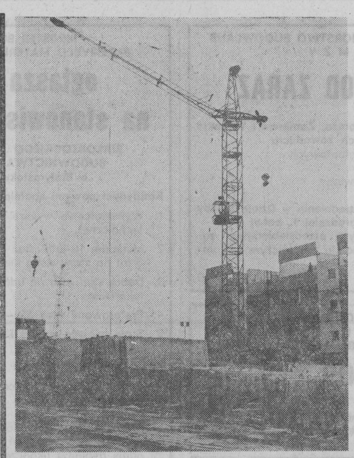
Równie kolejny budynek patronacki w Łomży.