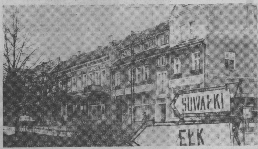
Z wędzówek naszego fotoreportera: Olecko w woj. suwalskim w oczekiwaniu na prawdziwą wiosnę. Fragment (po noc) największego rynku w Europie.

Wielkie miejsca podczas branżowych zebrani i narad poświęca się - co oczywiste - wdrażaniu w zakłady i przedsiębiorstwa komunikacyjno-drogowych reformy gospodarczej. W ramach reformy szereg kol brało udział w opracowywaniu i realizacje program oszczędnościowy, jak choćby w zakresie lepszego wykorzystania materiałów pochodzenia miejscowego do budowy dróg, a chodzi o żwir, żwz, pospółkę, popiół, żużel itp. RDP w Białymstoku w ubiegłym roku wbudował w nawierzchnie dróg 1600 Mg popiołów i 600 Mg żużlu, pochodzących z EC II metoda opracowaną przez członków koła. Wykorzystanie żużlu i popiołu jako dodatku do uszlachetnienia pospółki uzielminowało wywóz tych odpadów na wysypisko w Suwałkach, co ma kapitalne znaczenie dla ochrony środowiska.