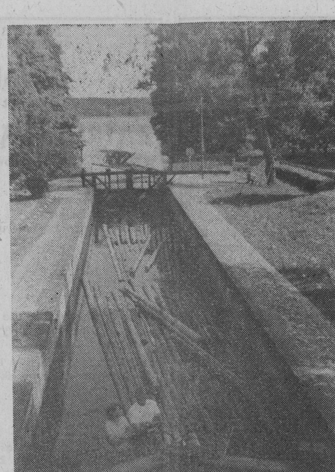
Służa Przewoź. Przeprowadzenie tratu.

Podobne sytuacje zdarzają się co roku. Mamy okres żniw i jak zwykle, na szosach i drogach bożych spotykają się miniaturowe maszyny rolnicze z pojazdami osobowymi, ciężarówkami itd.