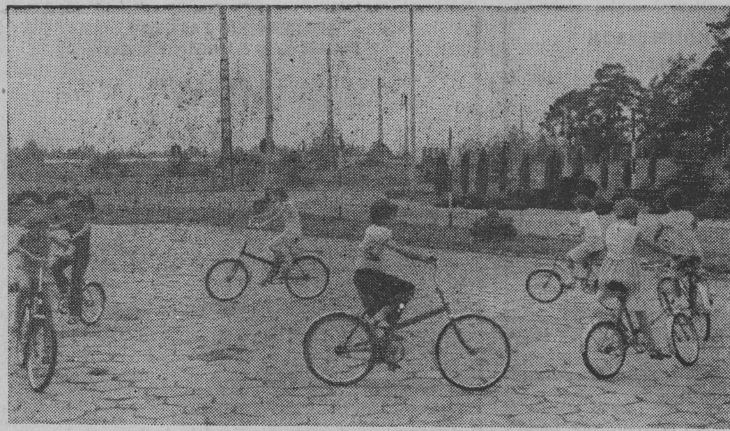
Na zdjęciu: Rowerowy tor przeszkód — to jedna z imprez organizowanych w ramach „NAL”-u