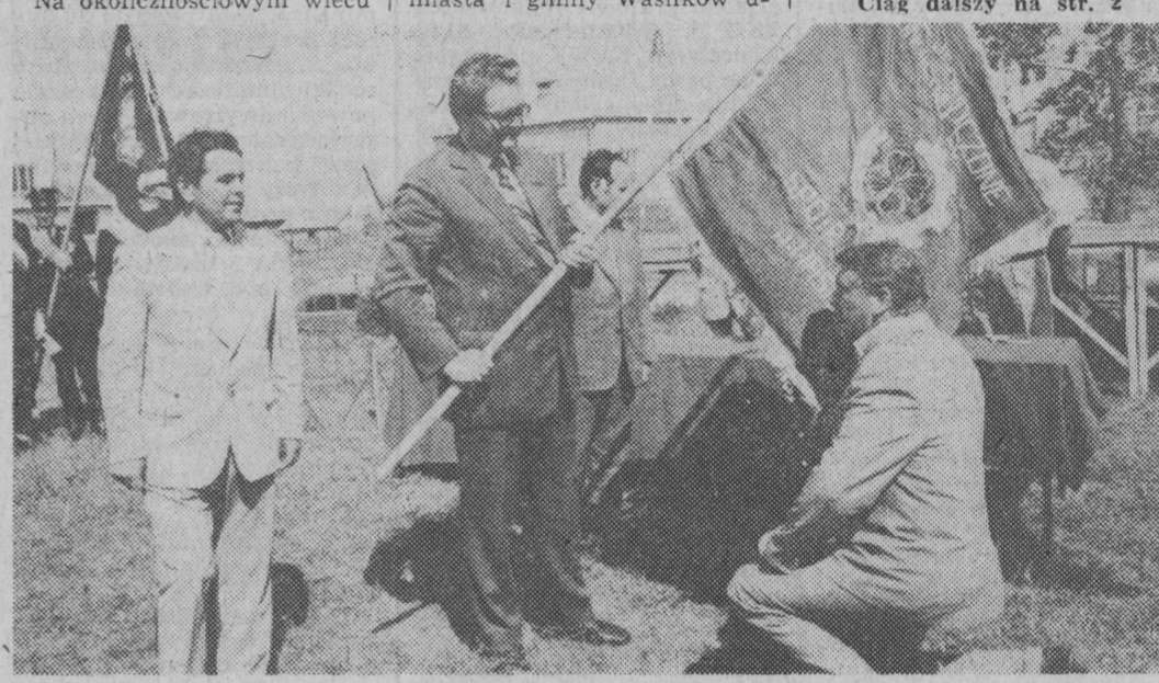
Prezes NK ZSL — ROMAN MALINOWSKI wręcza sztandar organizacyjny koła ZSL w RSP „Tulipan”.