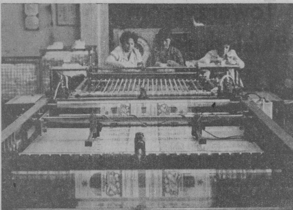
A tak powstają kolorowe torby do pakowania mrożonek mięsnych i warzywnych.

Niech każdy, komu droga jest nasza Ojczyzna, łączy swoje wysiłki z wysiłkami ludzi dobrej woli. Niech będzie to nasza troska o kraj, jego bezpieczeństwo i stabilizację. Uczynimy wszystko, co leży w naszej mocy dla dobra narodu polskiego i ludowego państwa.