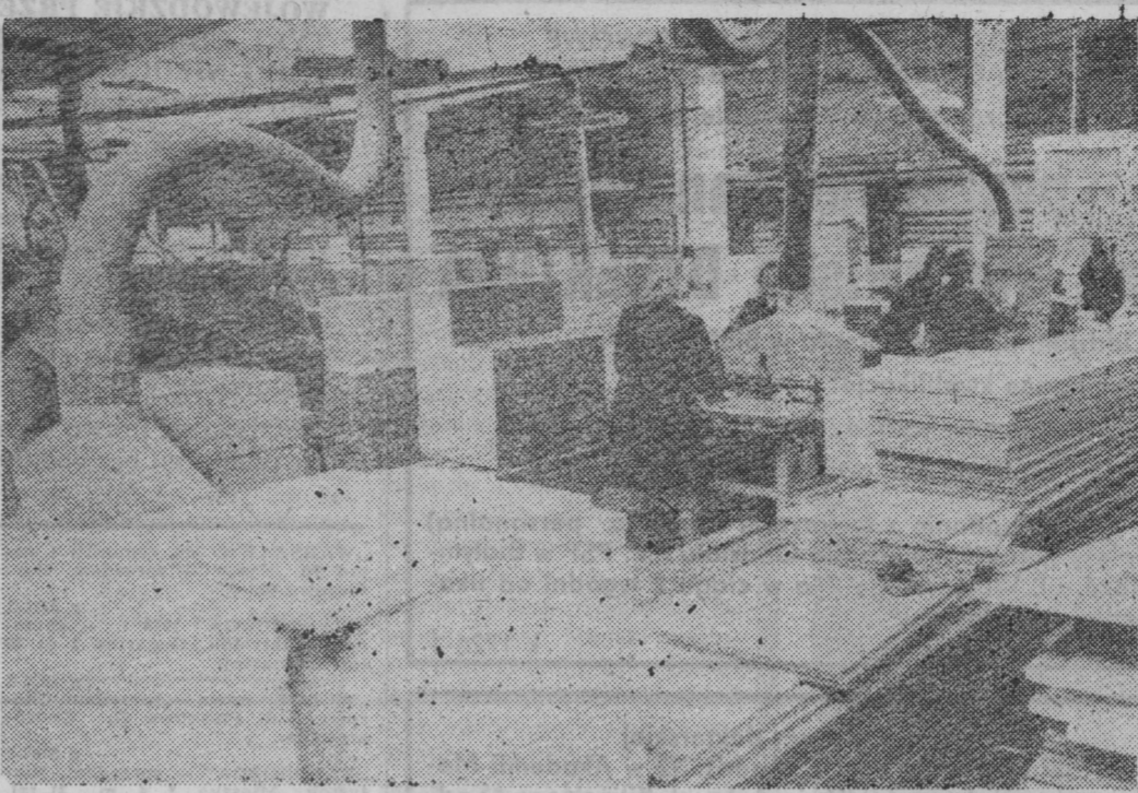
Fragment wydziału przygotowania produkcji.

Nadchodzące lata — stwierdzono w dyskusji — wymagać będą wielu przedsięwzięć w tworzeniu bazy lokalowej dla wychowania przedszkolnego — głównie w Wysokiem Mazowieckiem, Zambrowie, Łomży, Grajewie i Kolnie, dla szkół podstawowych i ponadpodstawowych, tworzenia lepszych warunków pracy nauczycieli na wsi, wyrównania dysproporcji w wyposażeniu szkół w sprzęt i pomoce naukowe, a także zapewnienia wykwalifikowanej kadry pedagogicznej. Wielezakończe tych działań wymaga inwestycji, o dziś szereg jest trudno. Jak więc zrealizować wspomniane zadania? Pytanie pozostaje otwarte. (jtb)