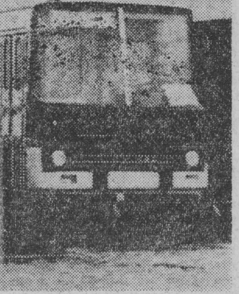
Wrocławiu dla MPK.

„Karta Nauczyciela” to dokument, który rodzi się także w ogniu społecznych konfliktów. Obecnie „Karta Nauczyciela” jest wiadomością Sejmu, który gotów jest uszczelnić go dopóki nie formalności pierwsze czytania na posiedzeniu Izby — rozpocząć prace nad projektem tego ważnego dokumentu w Komisji Oświaty i Wychowania.