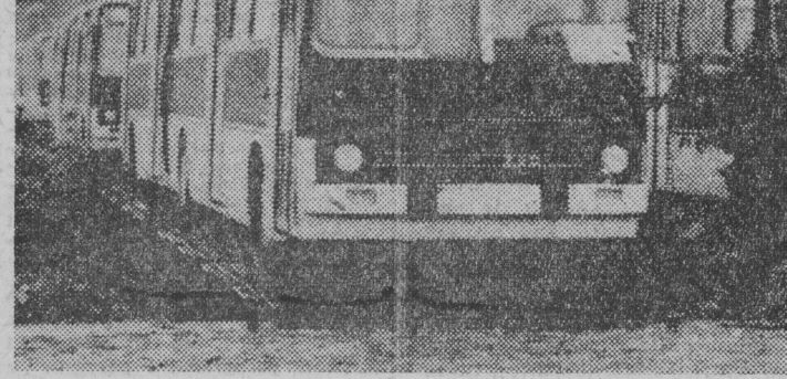
Kolejny transport autobusów „Ikarus” z Węgier przybył do Wrocławia dla MPK.

Głównym zadaniem komisji jest ocena rozmiarów strat, jakie niesie ze sobą akcja strajkowa dla gospodarki kraju, w tym dla przemysłu o-