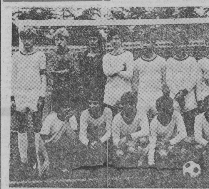
Piłkarze Jagiellonii - srebrni medalisti VIII OSM...