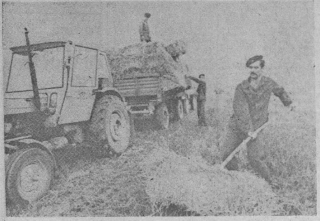
Żołnierze Ludowego Wojska Polskiego pomagają w tegorocznych żniwach. NA ZDJĘCIU: przy zbiorze słomy z pól Kombinat PGR Frącków pracują żołnierze z 10 Sudeckiej Dywizji Pancerniej.