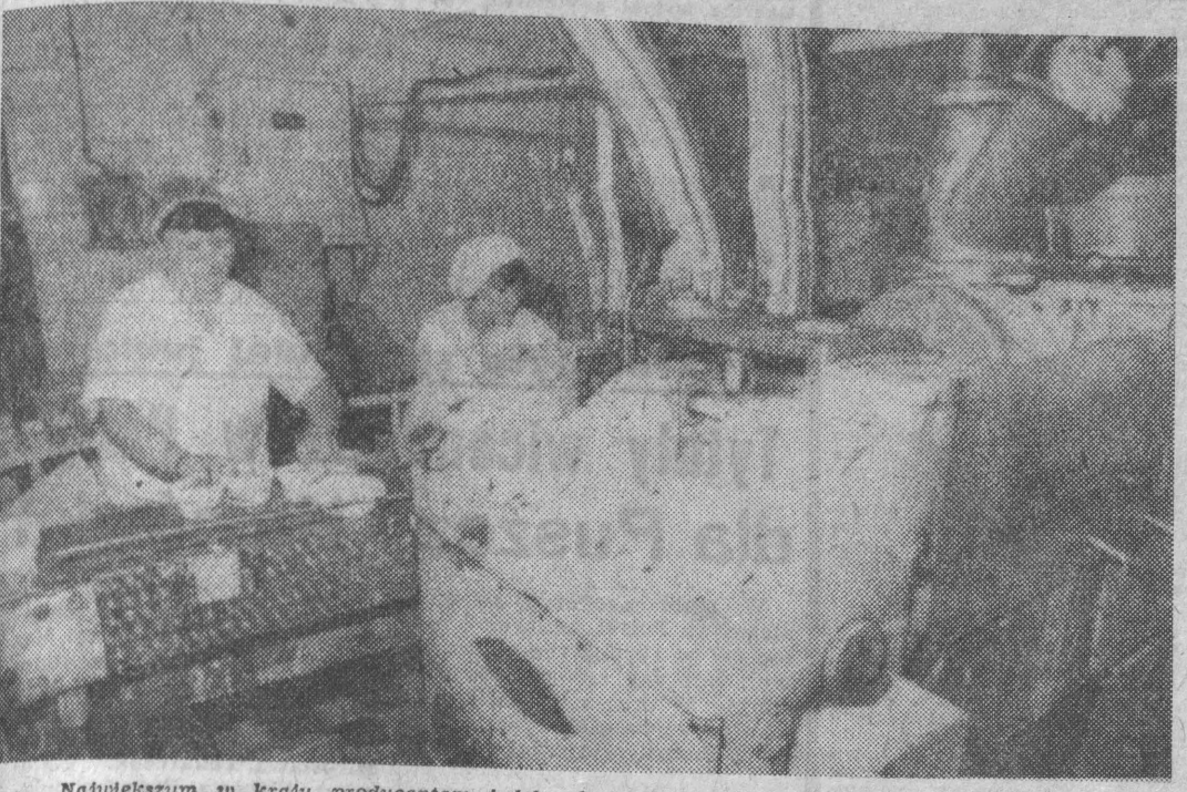
Największym w kraju producentem jadalnych tuszycy roślinnych są Zakłady Przemysłu Tuszycy w Kruśzowie (woj. bydgoskie). Roczna wartość produkcji margaryny, masła roślinnego i oleju uwarzonego, w zakładzie uruchomiono ostatnio dodatkową linię produkcji margaryny. NA ZDJĘCIU: produkcja margaryny i masła roślinnego w Zakładach Przemysłu Tuszycy w Kruśzowie.

Nr 253 (9229) Białystok — Łomża — Suwałki, wtorek, 25 listopada 1980 r. NAKŁAD: 142.278 A Cena 1 zł