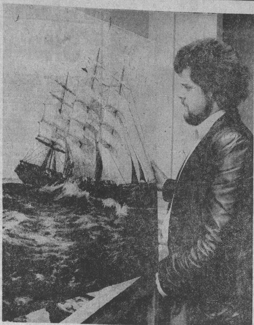
Różnorodne zainteresowania twórcze wykazują pracownicy PKP. Ich plonem jest wystawa, która wzbudziła duże zainteresowanie.

Kola LZS dysponują jednak skromną bazą sportową. Brak funduszy na zakup sprzętu sportowego oraz utworzenie kadry instruktorskiej. Dotychczasowa pomoc finansowa ze strony instytucji związanych z rolnictwem jest symboliczna. (lat)