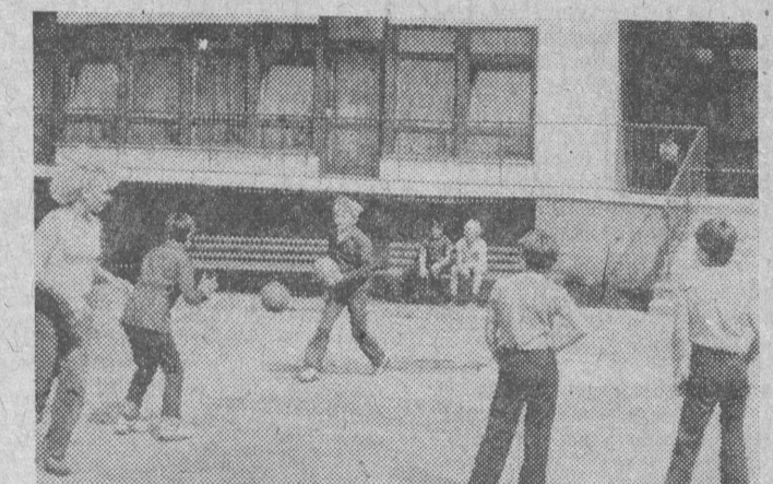
Dzieci mogą pohulać do woli na świeżym powietrzu.

W okresie od 29 lipca do 18 sierpnia br. w Ośrodku Kolonijnym - Szkolnym „Sokolik” w Łażniach