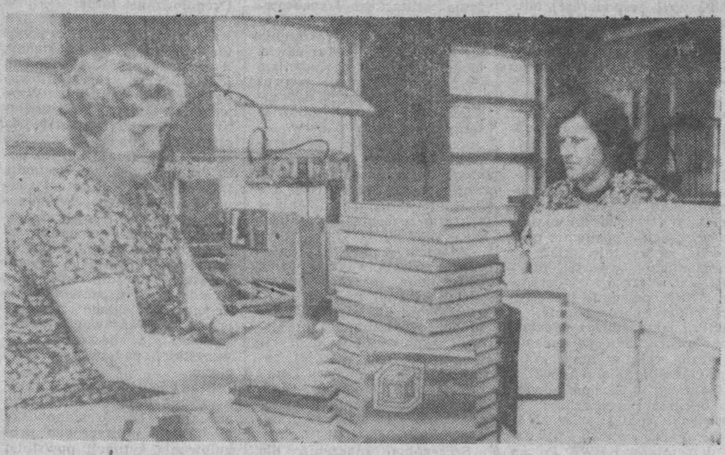
Podręczniki szkolne z Zakładów Graficznych Wydawnictw Szkolnych i Pedagogicznych w Łodzi.

WARSZAWA (PAP) — Z dnia na dzień, w miarę obychania pól i nieco szerszych możliwości stosowania cięższych maszyn, wzrasta tempo sprzątu zbóż i drugiego pokosu traw.