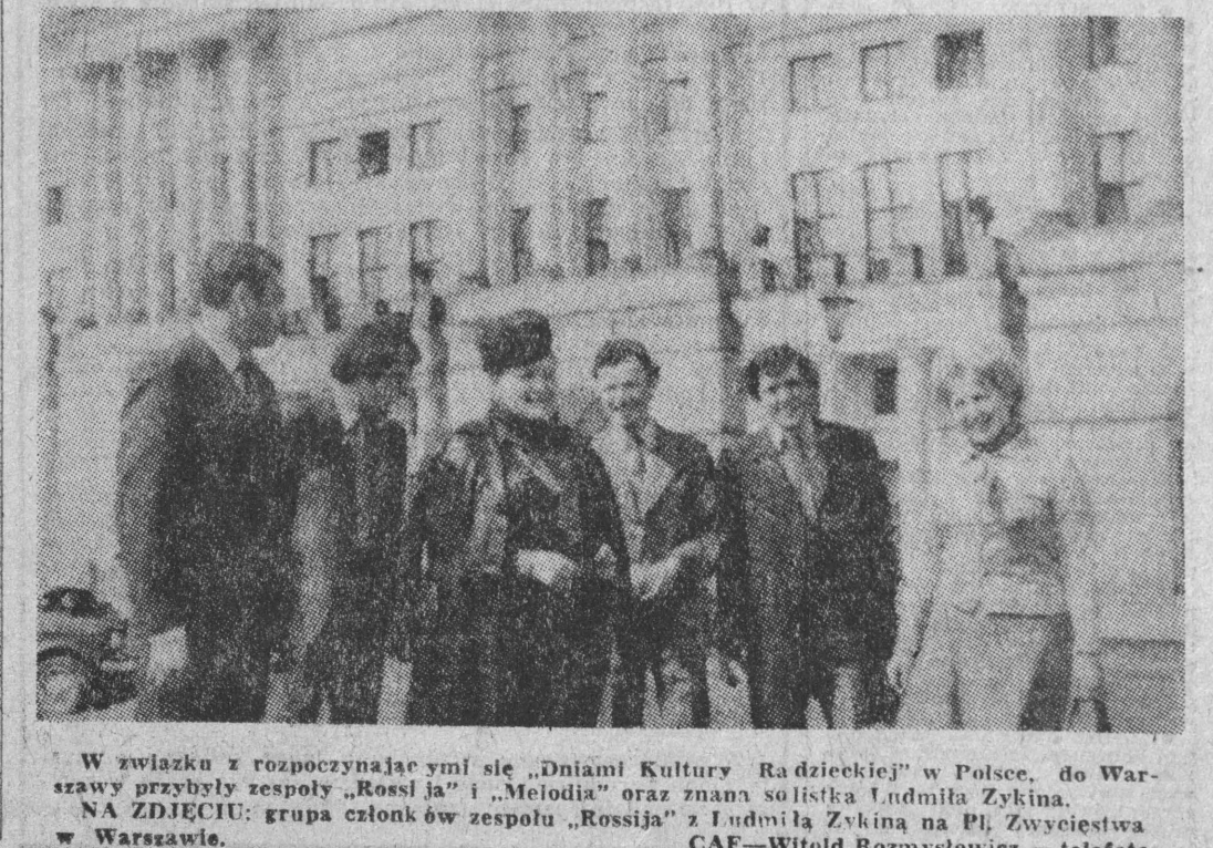
W związku z rozpoczynającymi się „Dniami Kultury Radzieckiej” w Polsce, do Warszawy przybyły zespoły „Rossija” i „Meiodia” oraz znana solistka Ludmila Zykina. NA ZDJĘCIU: grupa członków zespołu „Rossija” z Ludmilą Zykiną na Pl. Zwycięstwa w Warszawie.

Prezschronna tegoroczna prezentacja dorobku Kraju Rad zbiega się z doniosłymi rocznicami: 35-leciem Układu o Przyjaźni Współpracy i Pomocy Wzajemnej między PRL i ZSRR, 35-rocznicą zwycięstwa nad faszystami i 110 rocznicą urodzin Włodzimierza Lenina. Te właśnie historyczne