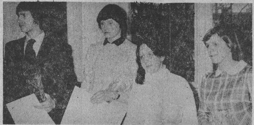
Zwycięzcy Plebisytu „Gazety Współczesnej” i WFS — na pięciu najlepszych sportowców woj. łomżyńskiego w roku 1979...