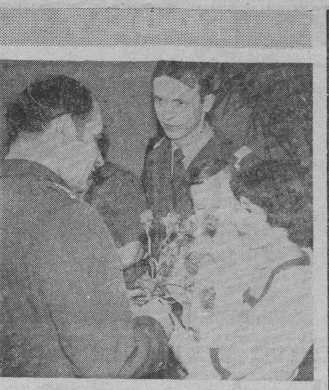
Święto małej Marty

Przebudowa ul. Suwalskiej w ŁEKU, która ma trwać blisko trzy lata, pociągnie za sobą konieczność ścięcia kilkuset drzew, które zasługują na rzeźbiarski treatment. Pierwszą grupą drzew, a były to piękne, stare okazy, zostały częściowo zmarnowane, gdyż podobno było to taniej wyrzucić je na śmietnik niż uratować i posadzić.