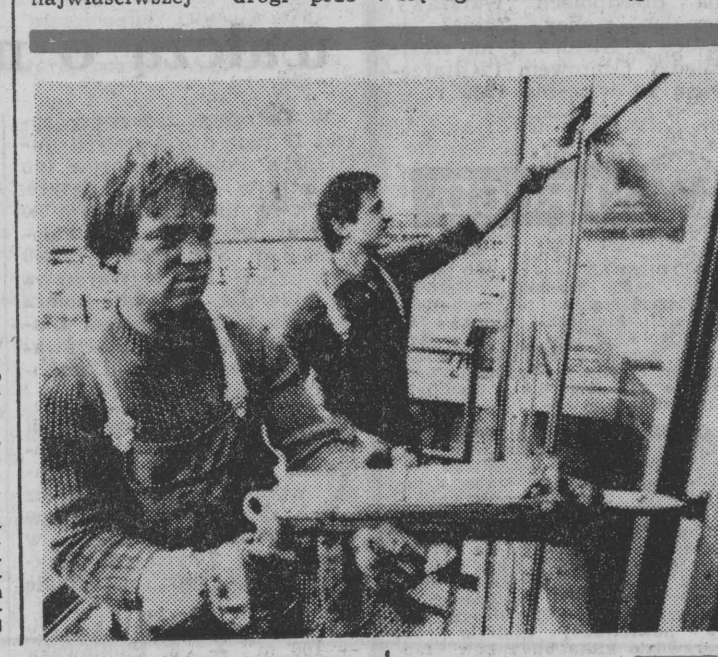
ciąg dalszy na str. 2

Obecnie wartość produkcji chemicznej w krajach europejskich wynosi ok. 300 mld dolarów rocznie, co świadczy o skali i znaczeniu tego przemysłu dla gospodarki. W ciągu kilkudniowych obrad uczestnicy seminarium przedyskutują m.in. nowoczesne metody i techniki planistyczne stosowane w reprezentowanych przez nich krajach. Przewiduje się konfrontację poglądów na temat wykorzystania ropy naftowej jako perspektywicznego źródła energii i surowca dla przemysłu chemicznego. Specjaliści — oraz częściej mówią bowiem o potrzebie przeprowadzenia szczegółowej analizy w celu ewentualnego zastąpienia ropy — węglem. Problemy te rozważane będą nie tylko na podstawie teoretycznych dyskusji, ale również doświadczeń, jakie wynikają z pracy czynnych już w świecie instalacji, zajmujących się zgasowaniem węgla.