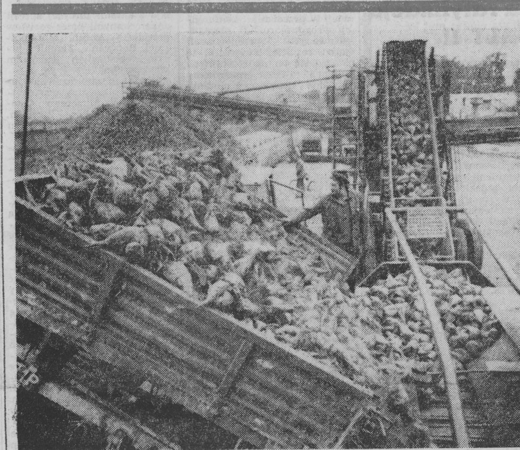
ciąg dalszy na str. 2

miejsca poświęcono sprawie konfliktu na Bliskim Wschodzie. We wszystkich poruszonych kwestiach panowała zgodność poglądów. Ch. Baghdasz poinformował o działalności swojej partii w dziedzinie umacniania i rozszerzenia postępowych przeobrażeń w Syryjskiej Republice Arabskiej. Przedyskutowano kierunki rozszerzenia kontaktów między PZPR i Syryjską Partią Komunistyczną. Z zadowoleniem podkreślono, iż postępujący rozwój między państwowych stosunków polsko-syryjskich dobrze służy interesom obu narodów.