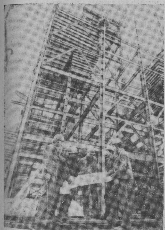
W Belchatowie (woj. piotrkowskie) w pobliżu powstającej odkrywkowej kopalni węgla brunatnego budowana jest elektrownia. Obecnie najważniejsza jest budowa pierwszego bloku 360 MW. Tęże większość prac skoncentrowana jest na montażu konstrukcji budynku głównego, elektrofiltrów i kotłowni.