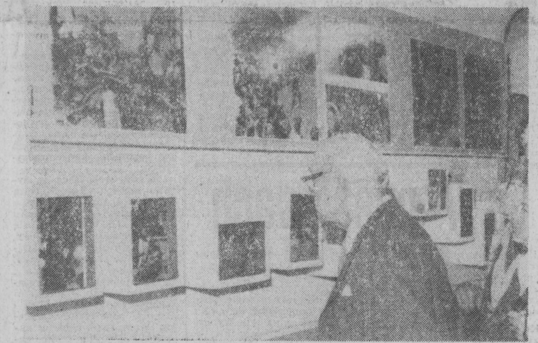
W przeddzień 35 rocznicy wybuchu Powstania Warszawskiego 31 lipca br. o godz. 12 w Muzeum Historycznym m. st. Warszawy otwarta została wystawa pod nazwą „POWSTANIE WARSZAWSKIE w fotografii i pamiątkach. NA ZDJĘCIU: fragmenty wystawy.