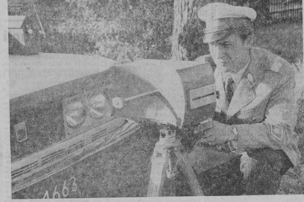
Radarowy miernik szybkości ustawiony na jednej z ulic wylotowych z Białegostoku. Często „dzwonił” sygnalizując zbyt dużą szybkość.