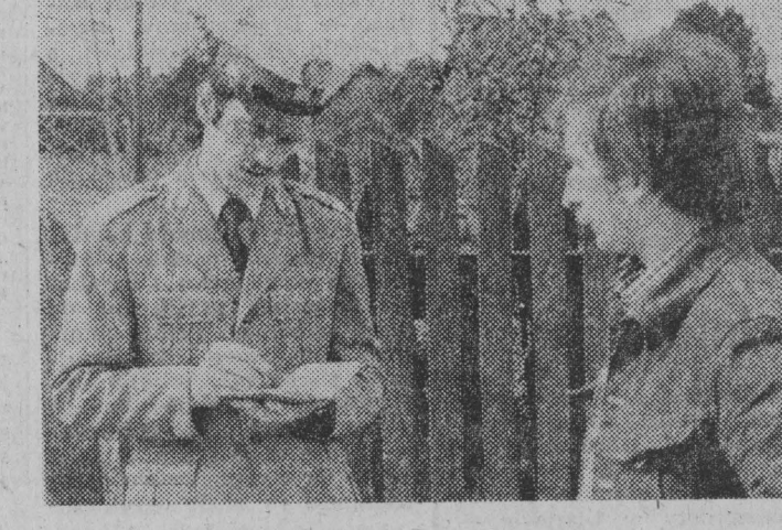
Kierowca „Wartburga” jadący na grzyby bardzo spieszył się, popełnił wykroczenie i został ukarany.

Z informacji otrzymanych z Wydziału Ruchu Drogowego KW MO w Suwałkach wynika, iż ruch na drogach tego województwa przebiegał bez specjalnych zakłóceń. Sprawne prowadzona akcja dała pozytywne wyniki. Zarówno turyści, jak i stali mieszkańcy województwa — poza nielicznymi przypadkami jeździłi poprawnie. Minęła sobota i niedziela, jeszcze jeden letni weekend. Mimo poprawy pogody i wzmożonego ruchu, na drogach trzech województw nie odnotowano wzrostu ilości wypadków. To cieszy i skłania do refleksji: jeśli chcemy bezpiecznie jeździć i chodzić, to potrafimy. A może by tak na co dzień?