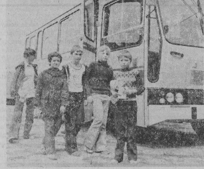
„Mazurskie Wiatry” wracają z Grajewy.