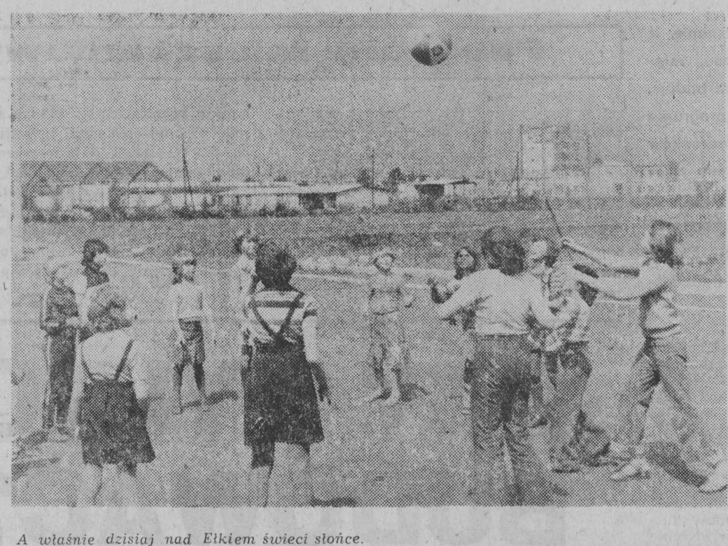
A właśnie dzisiaj nad Elkiem świeci słońce.