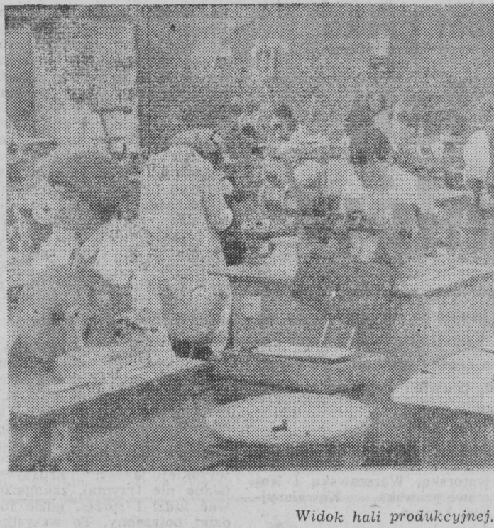
Widok hali produkcyjnej.