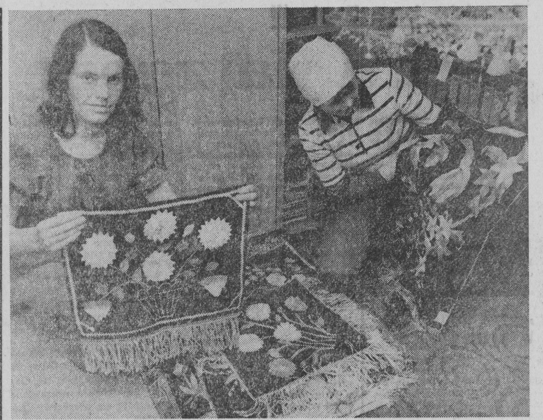
Makatek ręcznie haftowane o podlaskich wzorach.