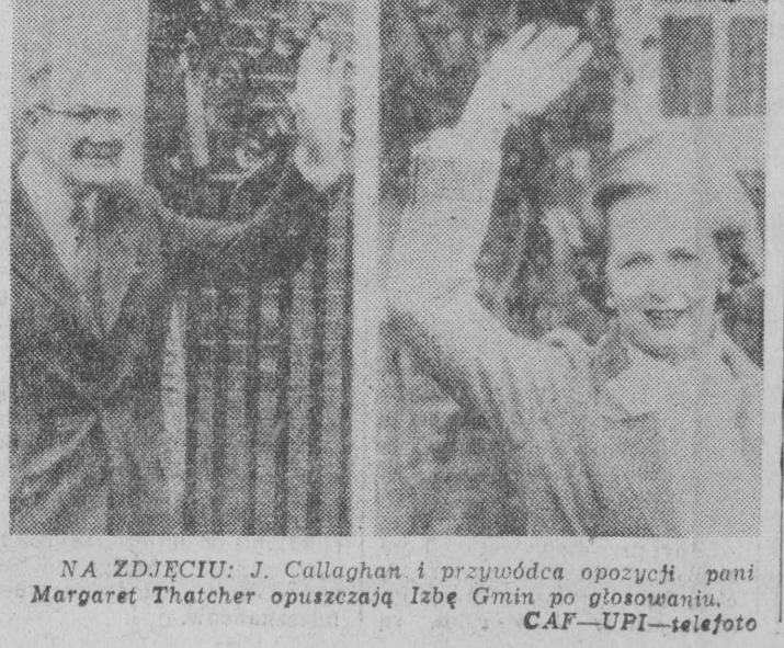
NA ZDJĘCIU: J. Callaghan i przywódczyni opozycji Margaret Thatcher opuszczają Izbę Gmin po głosowaniu.