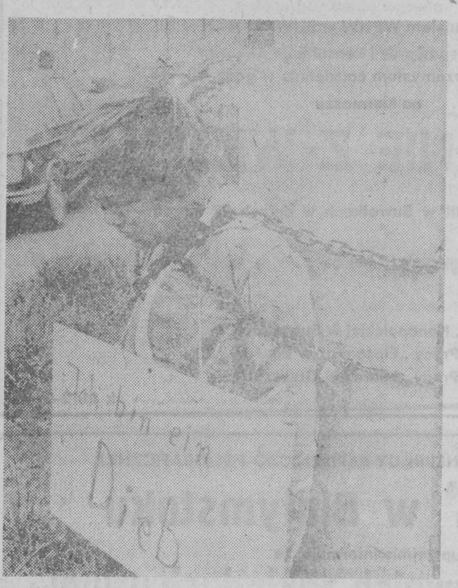
„Jestem złodziejem” — metody wychowywania dzieci w RFN...