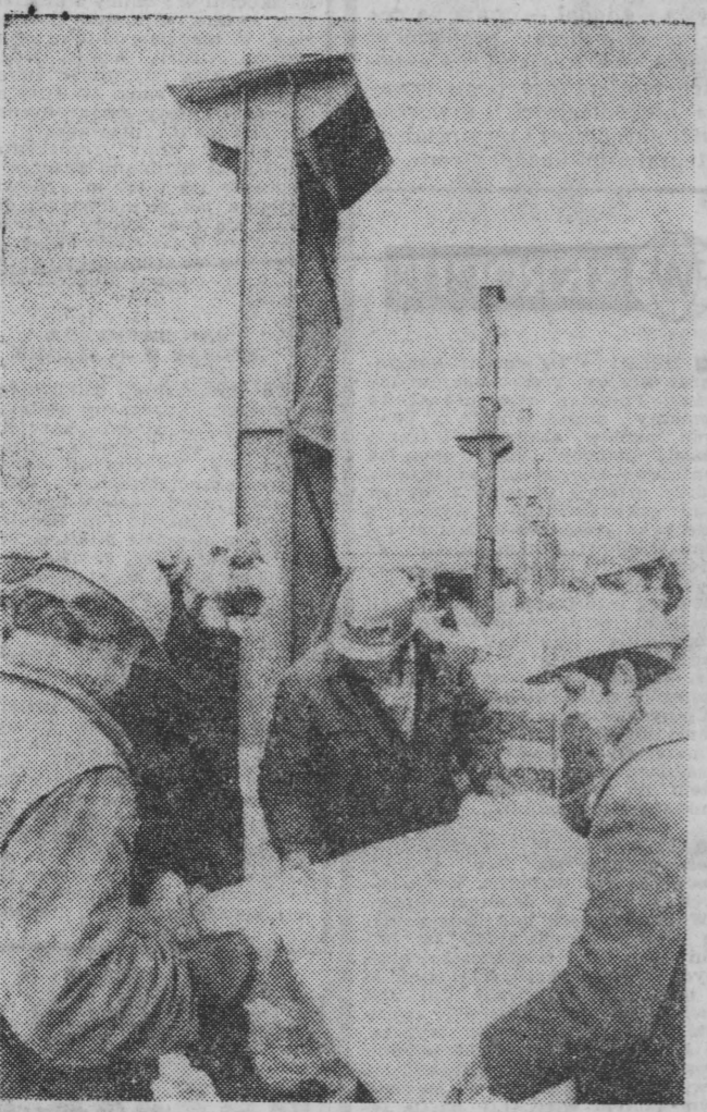
W Lublinie powstaje największa w kraju odlewnia, która pracować będzie dla potrzeb przemysłu motoryzacyjnego. NA ZDJĘCIU: przedstawiciele „Mostostalu” — jednego z wykonawców omawiają szczegóły budowy.

Przedstawiciele środowiska historycznego przedstawili założenia programu XII Powstającego Zjazdu Historyków Polskich, który zbierze się we wrześniu w Katowicach. Ta wielka impreza naukowa, organizowana co pięć lat, odbywać się będzie w tym roku pod hasłem: „Człowiek — praca — środowisko”. W trakcie spotkania przedstawiciele ZG PTH poinformowali przewodniczącego Rady Państwa także o jubileuszu półwiecza Instytutu Historycznego UW, w którym prof. dr Henryk Jabłoński przez wiele lat kierował Katedrą Historii Najnowszej.